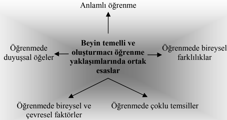
Şekil 1. Beyin Temelli ve Oluşturmacı Öğrenme Anlayışları Arasındaki Ortak Esaslar

İki yaklaşım da öğrenmeyi bir olgu olarak ele alarak çeşitli yönleriyle ortaya koymuş ve öğrenme olgusundan yola çıkarak öğretime yönelik çıkarımlarda bulunmuştur. Bu örtüşmeye farklı bir bakış açısıyla yaklaşan Bruer’e (1999) göre beyin temelli öğrenme yaklaşımının oluşturmacı öğrenme yaklaşımından farklı olarak ortaya koyduğu hiçbir ilke yoktur. Bir yandan bu çalışma da Bruer’in bu iddiasını destekler niteliktedir. Ancak diğer yandan bu benzerliğe Bruer’e göre farklı bir perspektiften bakmaktayız. Bir çelişkidenden çok ortak esaslar yoluyla bu örtüşmenin, örtüşme olması dolayısıyla eğitim alanında hem kuramsal hem de pratik olarak bu bölümde ele aldığımız üç açıdan çok anlamlı olduğunu söyleyebiliriz.