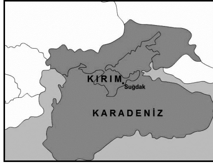
Şekil-2: Kırım Hanlığı 7

Rusya, Kırım ve Kafkasya'da ele geçirdiği yerlerdeki nüfuz ve hâkimiyetinin kesinleşmesi için çok yönlü sömürge, iskân ve asimile politikası izlemeye başlamıştır. Takip edilen politikanın esasını; demografik üstünlük sağlamak, bölgenin verimli ekonomik kaynaklarına sahip olmak, Osmanlı Devleti'ne taraftar olan kitleyi her ne şekilde olursa olsun bölgeden uzaklaştırmak, Müslüman nüfusun dini ve kültürel değerlerini bozmak ve böylece onların dinamizmini sağlayan bu değerlerden kopararak Ruslaştırılmasına zemin hazırlamak oluşturmuştur. 6