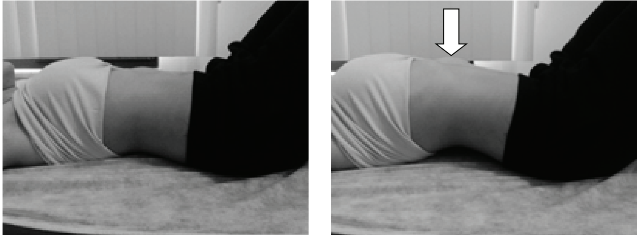
Şekil 1. Sırtüstü pozisyonda uygulanan simetrik fizyolojik® mobilizasyon egzersizi

“PairedSamples T” testi, *Wilcoxon” testi