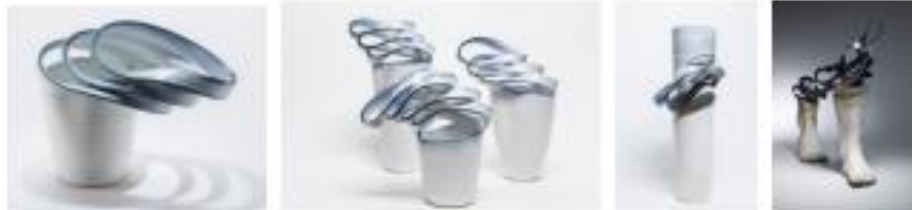
Görsel 7-8-9-10: Haejin Lee, “Sculpture Vases”, “Heykel Vazolar”, “Ceramic Sculpture”, “Seramik Heykel”, 2016, https://mymodernmet.com/haejin-lee-unraveling-ceramic-sculptures/ - 13 Mayıs 2022 https://www.thisiscolossal.com/2015/08/ceramic-sculptures-that-unravel-before-your-eyes/ - 13 Mayıs 2022.

Yapısöküm üzerinden okunabilecek diğer bir sanatçı Güney Kore’li Haejin Lee , bitmiş bir formu parçalara ayırmayı, sonrasında parçaları farklı biçimlerde birleştirmeyi, süreç içerisinde yeniden inşa ettiği formlarının ritmik bir bileşimi ifade ettiğini ve kendisine özgürlük hissi verdiğini vurgulamaktadır. Saatlerce çalıştıktan sonra bir eseri kesip parçalara ayırmak sinir bozucu bir eylem olarak görülse de sanatçı bu eylemi heyecan verici bir duygu olarak nitelendirmektedir. Lee’ye göre, kil malzemenin hakkında çok iyi bilgi sahibi olmadan yeni biçimler oluşturulamaz ve yüksek sıcaklıklarda kilin hangi reaksiyonları vereceği öngörülemezdir (URL 7).