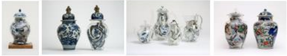
Görsel 3-4-5-6: Bouke De Vries, “Memory Vessels”, “Hafıza Kapları”, 2013, 2014, 2014, 2016 boukedevries.com – 22 Haziran 2022.

Yapısöküm düşünce yöntemiyle maddi kültür ve hafıza kavramlarını sorgulayan ve görsel bir dil kullanan diğer bir seramik sanatçısı Hollandalı Bouke De Vries , çalışmalarına kırılmış porselen parçalarını birleştirerek başlamıştır. De Vries, savaş, barış ve kaos kavramlarının yanında klasik sembolleri ironik bir şekilde kullanarak, kırılan porselen parçalarını kavramı gereği, yeniden hayata geçirmektedir.