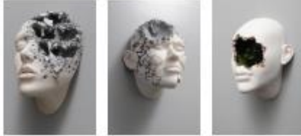
Görsel 51-52-53: Johnson Tsang, "Lucid Dreams", "Lucid Rüyaları" serisi:

ettiğini düşünmektedir. Eserlerinde insan yüzünü kullanan sanatçı, duyguların yüz üzerinden daha net bir şekilde izleyiciye aktarıldığını savunmaktadır.