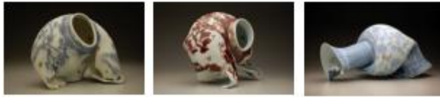
Görsel 35-36-37: Steven Young Lee, “Gold Butterflies”, “Altın Kelebekler”, 2011, porselen, kobalt oksit, altın lüster, “Pine Tree and Cardinals”, “Çam Ağacı ve Kardinaller”, 2013, porselen, bakır oksit, “Peonies and Butterflies”, “Şakayık ve Kelebekler”, 2013, porselen, kobalt oksit, altın lüster, https://stevenyounglee.com - 13 Eylül 2021.

Amerika’da Koreli bir ailenin oğlu olarak büyüyen Steven Young Lee hem büyük metropollerde hem de kırsal bölgelerde yaşamını sürdürdüğü ve çalıştığı için, bir kültürden diğerini gören ve aynı zamanda kimlik ve asimilasyon konularını ele alan yapıtları ile öne çıkmaktadır. Bu bağlamda, yer ve aidiyet meselesini yeniden sorgulama, yorumlama ve yüzleşme olanağı bulmaktadır. Çeşitli kültürlerden form, renk ve malzemeyi bir araya getiren Lee, tarihi seramiklere olan tutkusuyla günümüz sanatı arasındaki etkileşimleri ortaya koymaya çalışmaktadır.