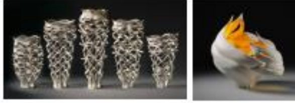
Görsel 15-16: Jennifer Mc Curdy, “Strip Vases”, “Şerit Vazoları”, 2021, “Gilded Wind Vessel”, “Yaldızlı Rüzgâr Gemisi”, 2019, https://www.jennifermccurdy.com/currentwork.shtml - 25 Mayıs 2022.

Mc Curdy, çömlekçi çarkında ürettiği formlarının sürece bağlı olarak hareketinin fırında da bütünlüğünün bozulmaması adına hem dışbükey hem de içbükey uygulamalarla yaşamın dengesini yansıtan çalışmalar ortaya koymaktadır. Sanatçı diğer seramik sanatçıları gibi çarktan çıkan formları malzemenin doğası gereği kurumadan, deri sertliğinde iken kısa bir zaman aralığında keserek soyutlamaktadır (URL 12). Çalışmalarında ışık ve gölge hareketlerini ortaya çıkartmak için formun biçimini değiştiren sanatçı, döngüsel dünyadaki olumsuzlukları olumlu yöne çevirmenin altını çizmektedir (Görsel 15-16).