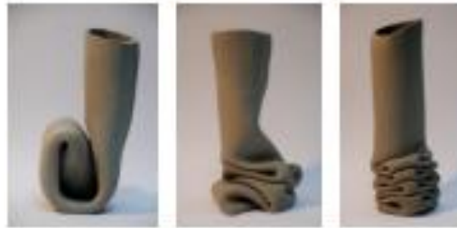
Görsel 54-55-56: Pieke Bergmans, "A Unique Production From Unique Vase", "Eşsiz Vazolardan Eşsiz Bir Üretim", seramik, 2007, https://www.piekebergmans.com - 11 Ocak 2022.

Hollandalı sanatçı Pieke Bergmans , sanat ve tasarım ilişkisini zorlayan ve 21. yüzyılın en etkili sanatçılarından biri olarak kabul edilmektedir. Eserlerinin büyük bir kısmını elle şekillendiren sanatçı, malzemeye kendi yolunu seçmesi için olanak tanırken, değişime ve tesadüfe yer vermekle beraber formlarının yapılarını bozmaktadır. Çalışmalarında kişiliğini ve kimliğini bir şekilde yansıtan sanatçı hem özenle planladığı hem de kendiliğinden olma arasındaki gerilimi bir şekilde hissettirir ve formlarının yapılarını bozarken anda dondurması eylemiyle dikkat çekmektedir.