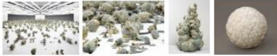
Görsel 68-69 (ayrıntı), 70-71: Yee Soo Kyung, "Translated Vase Thousand", "Dönüşen Bin Vazo", "Translated Vase 1", "Dönüşen Vazo 1", "Translated Vase Moon 1" Dönüşen Ay Vazo 1", 2012, https://www.yeesookyung.com/ - 26 Haziran 2023.

Sanatla zanaat, geçmişle bugün, Doğuyla Batı arasında bir bağ kurmaya çalışan Yee Soo Kyung , disiplinlerarası alanlardan yararlanan bir sanatçıdır. Kyung, kültürel hafıza, kaybolan tarih ve kişisel kimlik konularını kavramsal açıdan ele alarak eserler üretmektedir. Sanatçı, seramik eserlerin yapım sürecinden çok tamir sürecini bir anlatım dili olarak benimsemiştir. Çalışmalarında Japon Kintsugi tekniğini kullanan Kyung, kırılarak çöpe atılan seramik parçaları, kendi kültürüne ait nesne ve kavramlar aracılığıyla bir araya getirerek yeniden yorumlamaktadır. Sanatçının kullandığı yöntem, neyin daha değerli, neyin daha tarihi ve neyin sanat olduğunu izleyene sorgulatan bir yöntemdir (Yüksel, 2019, s.260). 2002 yılından itibaren "Translated Vase", "Dönüşen Vazolar" serileri ile tanınan Kyung, Kore hanedanlarından kalan kırılmış vazoya parçalarını toplayarak çatlakların arasını 24 ayar altınla birleştirerek eseri dönüşüme uğratmaktadır.