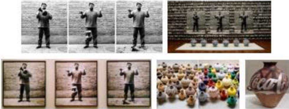
Görsel 57-58-59-60-61: Ai Weiwei, "Dropping the Han Dynasty Vase", "Han Hanedanlığı Vazosunu Düşürmek", 1995