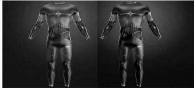
Şekil 11. Fastskin 4.0 Modelleri

Speedo, enerji toplayan kumaşı olan ve yüzücülerin 2040 yılına kadar %4 daha hızlı gitmesine yardımcı olabileceğini iddia ettiği yerleşik bir Artificial Intelligence Coach'a sahip ilk akıllı mayosunu tanıtmıştır. Fastskin 4.0 Modelleri için görsel Şekil 11'de verilmiştir.