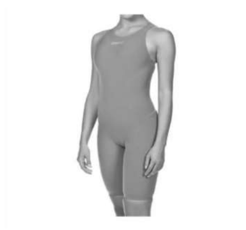
Şekil 10. Arena Hidroglit 78% Polyamid 22% Elastan [www.arenasport.com]