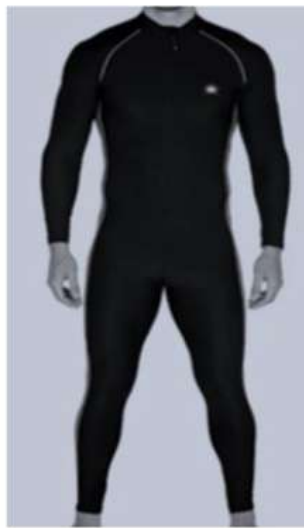
Şekil 3. Polyester İpliklerin Kullanıldığı Yüzücü Mayosu

Polyester genellikle petrolden elde edilen sentetik elyafır. Polyester dünyanın en popüler tekstillerinden biridir ve binlerce farklı tüketici için endüstriyel uygulamada kullanılmaktadır [Reisch, 1999][sewport.com/fabrics-directory/polyester-fabric]. Kimyasal olarak polyester, esas olarak ester fonksiyonel grubu içindeki bileşiklerden oluşan bir polimerdir. Çoğu sentetik ve bazı bitkisel esaslı polyester elyaflar, başka kaynaklardan da elde edilebilen petrolün bir bileşeni olan etilenden üretilir. Bazı polyester türleri biyolojik olarak parçalanabilir olsa da çoğunlukla polyester üretimi ve kullanımı dünya çapında çevresel kirliliğe sebep olmaktadır [Reisch, 1999][sewport.com/fabrics-directory/polyester-fabric]. Bazı uygulamalarda polyester, giyim ürünlerinin tek bileşeni olabilir, ancak polyester ipliğin, pamuk veya başka bir doğal elyaftan üretilen ipliklerle karışım olarak kullanımı daha yaygındır. Hazır giyimde polyester kullanımı üretim maliyetlerini düşürmek ile birlikte giyimin rahatlığını da azaltmaktadır. Polyester, pamukla karıştırıldığında, yaygın olarak üretilen bu doğal elyaftan çekmesini, dayanıklılığını ve kırışma profilini iyileştirir. Polyester içeren kumaş, çevresel koşullara karşı oldukça dayanıklıdır, bu da onu dış mekan uygulamalarında uzun süreli kullanım için ideal kılar [sewport.com/fabrics-directory/polyester-fabric]. Polyester ipliklerin kullanıldığı yüzücü mayosu Şekil 3'de görülmektedir.