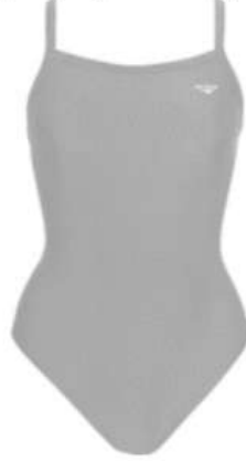
Şekil 4. Butterflyback, Xtra Life Lycra® (%80 Nylon, %20 Lycra) [www.thefinals.com]

Butterflyback, Xtra Life Lycra®'dan üretilen mayolar, geleneksel mayolardaki gibi istenmeyen "torbalanma ve sarkma" durumlarına karşı koymak için tasarlanmıştır. Bu mayolar su içinde ek güç ve destek sağlar. Zorlu antrenmanlara dayanan uzun süreli bir uyum sergileyen Xtra Life Lycra® süper Butterflyback, klora ve diğer havuz kimyasallarına karşı korumasız elastandan 5-10 kat daha uzun süre dayanmaktadır [www.thefinals.com]. Örnek ürün Şekil 4 görseli ile verilmiştir.