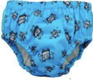
Şekil 1. Charlie Banana Mayo ve Alıştırma Külotları

Charlie Banana mayo ve alıştırma külotları tek kullanımlık bebek mayolarına göre daha sağlıklı olup kullanıcı dostu ürünlerdir. İç kısmı organik pamuktan üretilmiş Charlie Banana bebek mayolarıyla bebekler rahatsızlık hissetmemektedir. Charlie banana bebek mayolarını tamamen emici olması özelliğinden dolayı tuvalet eğitimi döneminde alıştırma külotu olarak da kullanabilmektedir [Www.Morhipo.Com].