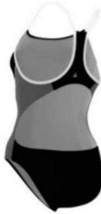
Şekil 9. Repreve Yüzme Mayosu

Önde gelen geri dönüştürülmüş elyaf Repreve® üreticisi Unifi Inc., müşterilerin ve tüketicilerin sürekli büyüyen okyanus plastiği sorununu çözmeye rol oynamasını sağlayan yeni bir sürdürülebilir ürün piyasaya sürmüştür. Okyanus plastiğinin temel nedeni ile başa çıkmak için Repreve® Our Ocean® elyafı, resmi atık veya geri dönüşüm sistemlerinden yoksun ülkelerde veya bölgelerde 50 kilometrelik kıyı şeridinde toplanan şişelerden üretilmektedir. Repreve yüzme mayosu Şekil 9'da görülmektedir.