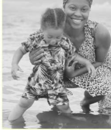
Şekil 5. Aloe Vera Mikrokapsüllerin Kullanıldığı Yüzücü Mayosu (www.moodfabrics.com)

Aloe Vera mikrokapsüller polyester süper mikro fiberler ve likranın bir kombinasyonundan oluşan, tutma yetenekleri ile birlikte dört yönlü bir esneme sağlayan bir 4 Max-Dri (maksimum kuruluk) performans trikodur. Bu triko, atletik performansı artıran yüksek basınçlı kumaş yapısı nedeniyle tayt ve şort gibi spor giyim ürünlerinin yanında, aynı zamanda 50+ UV koruması ve Aloe Vera mikrokapsülleri ile birlikte üretildiği için mayo üretiminde önemli bir seçenektir. Cildin nemlendirilmesine katkı sağlarken ayrıca, bu malzemenin leke ve kötü koku oluşmasını önleyen antibakteriyel işleminden geçmektedirler [www.moodfabrics.com]. Aloe Vera Mikrokapsüllerin kullanıldığı yüzücü mayosu Şekil 5’ te görülmektedir.