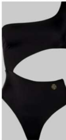
Şekil 8. Ekonil Yüzme mayosu ( www.urbankissed.com )

Econyl yapmak için nylonun yeniden kullanılması, petrolden üretilen malzemeye kıyasla nylonun küresel ısınma etkisini %80 oranında azaltır. Ayrıca, bu malzeme bitmiş üründe kalite kaybı olmaksızın sürekli olarak geri dönüştürülebilir [Ankeny, 2015][Thomas, 2019][ www.econyl.com/ ]. Ekonil Yüzme mayosu Şekil 8'de görülmektedir.