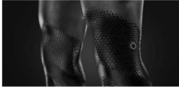
Şekil 13. Fastskin 4.0 Gövde Altı Derisi

En uygun güç için esneyen yerleşik bir dış iskelete sahipken, giysinin yüzeyi suda mükemmel akış için köpekbalığı derisini taklit etmek üzere biyolojik olarak tasarlanmıştır. Bu arada, bir çekirdek reaktör sudaki vücut pozisyonunu eşitler. Takım aynı zamanda bir AI Live Coach'a da sahip olduğundan antrenörleri kenardan bağırma ihtiyacından kurtarmaktadır. Yarıştan önce, yüzücülerin bloklara en iyi durumda ulaşmasını sağlamak için oksijen doygunluğu ve hidrasyon seviyeleri değerlendirilir. Sensörler daha sonra haptik teknolojisiyle bir sporcuya yarış ortasında teknik, hız, pozisyon ve kondisyon hakkında canlı koçluk sağlar. Yarış bittiğinde, yüzücüler vücudun laktat konsantrasyon seviyeleri gibi verilere erişerek iyileşmelerini izleyerek kontrol edebilecek ve mümkün olan en kısa sürede yarışa hazır olmak için dinlenmelerini sağlayacaktır. Takım, biyomühendislik, genetiği değiştirilmiş bakterilerden enerji hasat kumaşı ile üretilmiştir ve kendi kendine güç sağlamaktadır.