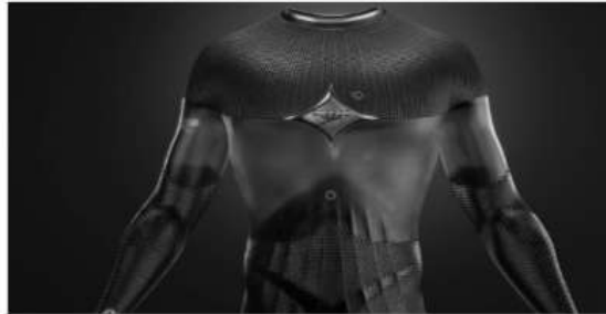
Şekil 12. Fastskin 4.0 Zoom

Fastskin 4.0 adlı fütüristik bir mayo konseptini tanıtan Speedo; biyo-mühendislik ürünüde genetiği değiştirilmiş bakterileri kullanmıştır. Böylelikle, biyolojik olarak parçalanabilir ve enerji toplayan kumaş tasarlanmıştır. Speedo, kostümün yüzücülerin 2040 yılına kadar %4 kadar daha hızlı gitmesine izin vereceğini iddia etmektedir. Bu tür gelişmeler, erkeklerin 50 m serbest stil rekorunun 20 saniye engelini aşmasını ve kadınların 100 m kurbağalama süresinin 60 saniye altına düşmesini sağlayabilir. Fastskin 4.0 konsepti Aqualab ile birlikte geliştirilerek ve tamamen yüzücünün vücuduna göre özelleştirilmiştir. Fastskin 4.0 Zoom ürün görseli Şekil 12'de ve Fastskin 4.0 Gövde Altı Derisi için ürün görseli Şekil 13'te verilmiştir.