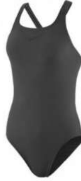
Şekil 6. Polibütilen Tereftalat (PBT) İpliklerin Kullanıldığı Yüzücü Mayosu