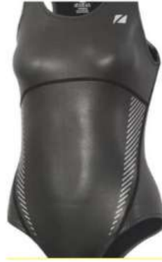
Şekil 7. Neopren yüzme mayosu