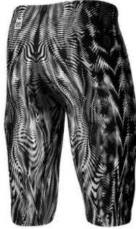
Şekil 14. TYR Üretim (70% Nylon, 30% Spandex) [www.tyr.com]

En son teknolojik takım yeniliği olan TYR Venzo™ mikroskobik bir perspektiften sürtünmeyi analiz eden sektördeki ilk ve tek teknik takım olan TYR Kadın Venzo™ Camo Kapalı Sırtlı Mayo sürtünmesiz ve dayanıklı bir kumaşa iplik geçirmek için ultra pürüzsüz elyaf kullanmaktadır. En son Surface Lift Technology™ ile tasarlanan bu model, suyun kumaşa nüfuz etmesini önleyerek suda daha yüksek vücut pozisyonu sağlar. TYR Venzo teknolojisi ile üretilen bir mayo takımının alt parçası Şekil 14'te örnek olarak gösterilmiştir.