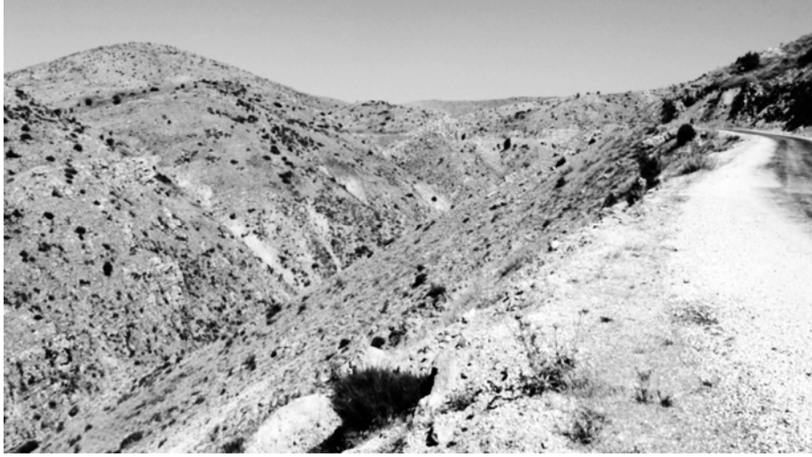
Foto 2. Karamık Beli'nin Güneyden Görünüşü

- Niketas Khoniates'in eserinde " Geçit dağların çöktüğü bir yerdedir " denilir. Karamık Beli ise yüksek Karakuş dağlık kuşağı üzerinde ulaşımaya geçit veren bir yerdedir. Karamık Köyü'nün doğusunda başlayan tali karayolu ile kıvrımlı bir şekilde nispi değerle yaklaşık 500/600 m yükseğe tırmanarak Karamık Beli'ne ulaşılmakta ve buradan eğim doğrultusunda inişe geçilmektedir. Böylece bu yolda dik bir çıkış ve sonrada oldukça eğimli bir iniş söz konusudur. Tarihi kaynaklarda bu şekilde bir bilgi mevcut değildir.