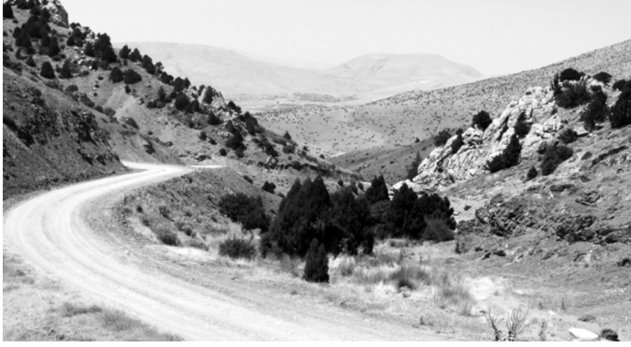
Foto 4. Aşağıkaşıkara Beli.

su vadisini ve dağın güneye eğimli yamaçlarını izleyen karayolu, ilk önce Aşağıkaşıkara Köyü (1025 m)'ne ve sonrada 925 m.de, Eğirdir Gölü kıyısına 2 km mesafede bulunan düzlük alana inmektedir. Bu yerler arasında yolun uzunluğu yaklaşık 12 km olup ulaşım bakımından nispeten elverişlidir (Foto 4).