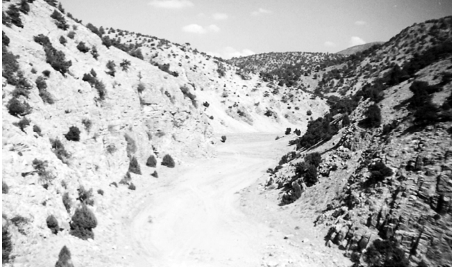
Foto 10. Orta Kûfi Boğazı'nın en dar ve en derin kesimi.

Orta Kûfi Boğazı'nın Ortadağ'a tekabül eden güney yamaçları daha yüksek ve diktir. Burada nispi yükseltisi 200-300 m.yi geçen Medine Tepe (1274 m) ve Harman Tepe (1134 m) gibi tepeler yer almaktadır. Boğazın kuzey kesiminde yükselti değerleri daha azdır ve bu tarafta da 1059 m ve 1072 m yüksekliğinde tepeler ile 1020 m yüksekliğinde sırtlar (Uzuncaburun Sırtı) bulunur. Boğazın yamaçları, güneyden Cevizli Dere, Çığıllı Dere, kuzeyden Cehennem Dere, Soğanlı Dere ve Çırçır Dere gibi çok sayıda sel karakterli akarsular tarafından özellikle vadi tabanına ulaştıkları yerlerde dar ve derin bir şekilde kazılmıştır. Bu kesimde yamaçların dik olması nedeniyle eski karayolu akarsu yatağını takip etmektedir.