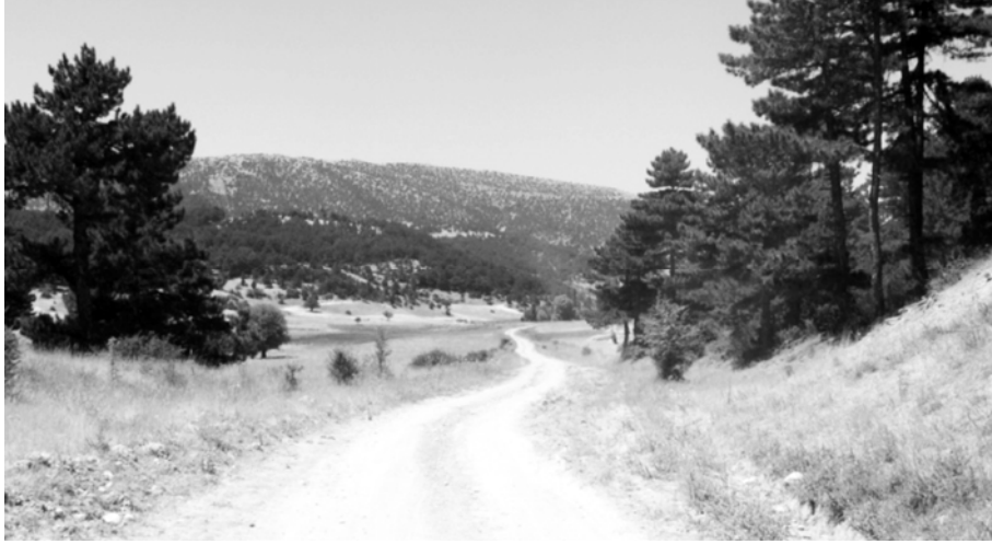
Foto 3. Yukarıkaşıkara Beli. Fotoğraf havza sınırına yakın bir yerden alınmıştır.

Yukarıkaşıkara Beli: Eğirdir Gölü'nün kuzeyinde, Karakuş dağlık kütlesi üzerinde kabaca kuzeybatı-güneydoğu istikametinde uzanmaktadır (Foto 3). Kuzeyde Karamık Ovası'nın kenarında bulunan Armutlu Köyü (1050 m)'nde, bataklık alana boşalan bir akarsu vadisini takip eden karayolu, yaklaşık 1400 m.den geçen su bölümü hattında, Yukarıkaşıkara Beli'nin en yüksek noktasına ulaşmaktadır. Buradan kabaca güneydoğu istikametinde uzanan ve Eğirdir Gölü (916 m)'ne boşalan yine başka bir akarsu vadisini takip eden karayolu Yukarıkaşıkara Köyü (1225 m)'nden geçerek, gölün yaklaşık 4 km kuzeyinde ve 1000 m yükseltide ova sahasına inmektedir. Bu yerler arasında yaklaşık 13 km uzunluğunda olan yolun bazı kesimlerinde ulaşım nispeten güçlkle yapılır.