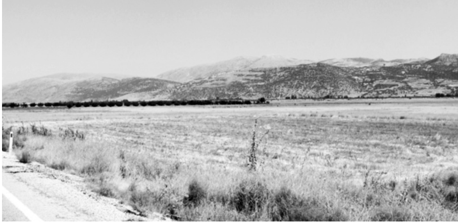
Foto 5. Eğirdir Gölü'nün kuzeydoğusundaki Kumdanlı Ovası'ndan bir görünüş.

Kumdanlı-Gökçeali Çevresi: Eğirdir Gölü'nün kıyısından itibaren kuzeydoğuda Mısırlı Köyü'ne doğru genişliği giderek azalan yaklaşık 16-17 km uzunluğunda alüvyal bir ova yer almaktadır. Kumdanlı yakınında genişliği yaklaşık 1.2 km olan ova sahası, batıda göl kıyısına doğru genişleyerek 5-6 km.ye ulaşmaktadır (Foto 5). Ovanın güney kenarını takip ederek Eğirdir Gölü'ne boşalan Köydere ile kuzeydeki dağlık kütleden beslenen birçok akarsu ovanın teşekkülünde önemli rol oynamıştır.