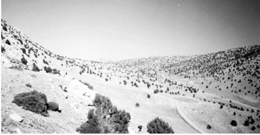
Foto 7. Çivril ve Sandıklı havzaları arasında tabii bir yol olan Düzbel.

ait diklikler topografya sathında belirginliğini korumaktadır. Hatta bu fay hattına ait dikliklerde yer yer asılı vadiler gelişmiştir. Güney yamacı ise daha az eğimlidir. Bu nedenle yamaçlar genellikle asimetric özelliktedir. Düzbel'in uzunluğu yaklaşık 13 km, deniz seviyesinden yüksekliği 1150-1400 m, Çivril Ovası'ndan yüksekliği ise 350-550 m civarındadır. Tabanı nispeten düz ve geniş olan Düzbel'in en dar yeri 200-250 m kadardır. Burası da, Dalyeri Tepesi (1797 m)'nin kuzeyinde, su bölümü hattının geçtiği kesime rastlar. Su bölümü hattından batıya doğru akış gösteren Sarp Dere, Düzbel Köyü civarında derin bir vadi oluşturarak ova sahasına inmektedir. 49