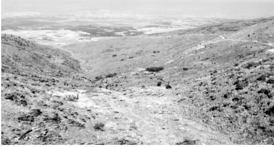
Foto 1. Karamık Beli'nden Kuzeye Bakış

- Niketas Khoniates'in eserinde " Geçit dağların çöktüğü bir yerdedir " denilir. Karamık Beli ise yüksek Karakuş dağlık kuşağı üzerinde ulaşımaya geçit veren bir yerdedir. Karamık Köyü'nün doğusunda başlayan tali karayolu ile kıvrımlı bir şekilde nispi değerle yaklaşık 500/600 m yükseğe tırmanarak Karamık Beli'ne ulaşılmakta ve buradan eğim doğrultusunda inişe geçilmektedir. Böylece bu yolda dik bir çıkış ve sonrada oldukça eğimli bir iniş söz konusudur. Tarihi kaynaklarda bu şekilde bir bilgi mevcut değildir.