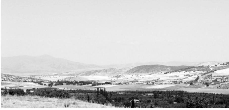
Foto 6. Gelendost Ovası'nın doğu kesimi ile Özdere vadisinin Bağlıllı'ya doğru uzanışı. Fotoğraf Gelendost Devlet Hastanesi'nin önünden alınmıştır.

Bu coğrafi özelliklere göre, Gelendost Ovası ve bunun devamı Özdere vadisi, Gümüşsu'ya göre konumu, topografik ve hidrografik özellikleri tarihi kaynaklarda belirtilen savaş yerinin coğrafi özellikleriyle örtüşmektedir. Bundan başka Myriokephalon Kalesi, Türk ordusunun konuşlanması ve savaşın yapıldığı tarzı gibi birçok özelliklerin açıklanmasında güçlükler vardır. Keza Myriokephalon Savaşı, Gelendost Ovası gibi bir düzlükte değil; dar, derin ve upuzun bir vadiye yapılmıştır. Özdere vadisinin jeomorfolojik özellikleri ise, tarihi kaynaklarda belirtilen savaş yerinden oldukça farklılık arz etmektedir. Çünkü Özdere vadisi nispeten düzgün bir uzanışa sahip olup, tabanı ve özellikle yamaçları geniş ve az eğimlidir. Bundan dolayı Bizans ordusunun bu vadiyi takip eden nispeten geniş karayolunda yürüyüş düzenini bozmadan birkaç kol halinde ilerlemesi mümkündür.