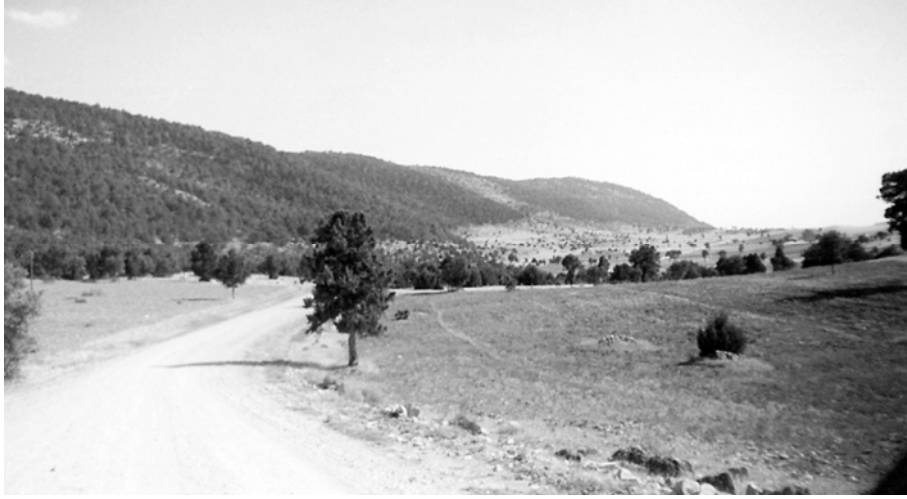
Foto 12. Osmerköy'ün yaklaşık 3 km kuzeyinde Kûfi Geçidi'nden bir görünüş.

mevsimlerine rastlayan yılın yaklaşık altı ayında ulaşım elverişli özellikler göstermektedir. Bu nedenle, tarihî çağlardan beri Çivril ve Sandıklı havzalarını birbirine bağlayan önemli karayolu bu boğaz güzergâhını takip etmiştir. Nitekim boğazın kuzey kesiminde Derbent Çiftliği adında bir yerleşmenin bulunması; boğazın Osmanlı Devleti döneminde de ulaşım bakımından yararlandırıldığına işaret etmektedir. Bugün de Çivril ile Sandıklı arasındaki en kolay ulaşım bu vadiyi takiben Ortadağ'ın yamacından geçen karayolundan sağlanmaktadır.