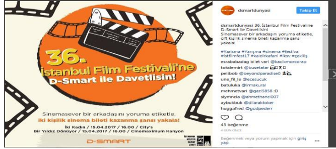
Şekil 4: D-Smart Instagram hesabından bir yorum sayfası

Sosyal paylaşım ağlarında her hangi bir dijital TV platformunun takipçileri, ilgilendikleri içeriği diğer “ağdaşları”na da aktararak yani kendi takipçileriyle paylaşarak daha çok kitlenin TV platformlarından paylaşılan mesajdan haberdar olmasını sağlarlar. Böylelikle verilen mesajın alıcısı konumundayken aynı zamanda kaynağı haline gelirler. Mesaj daha çok kitleye dağılırken, verilen linklerle de takipçilerin daha çok ayrıntılı içeriği görebilmesi ve haberdar olması sağlanmaktadır.