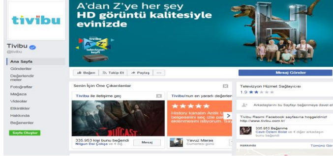
Şekil 2: Tivibu Facebook Hesabı Sayfa Görüntüsü

Değişik sosyal ağlarda kendilerine hesap açan dijital TV platformları sıfır maliyetli içerik sunma ve tanıtım mecrasına sahip olmaktadır. Ürün, fiyat, ulaştırma bilgileriyle satış sonrası hizmetlerle ilgili bilgiler kurumun internet sitesine ek olarak sosyal ağlar üzerinden de takipçilerle paylaşılarak daha çok hedef kitleye ulaşılmaya çalışılmaktadır.