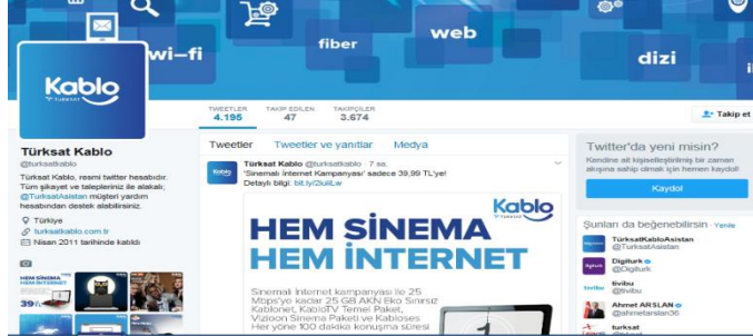
Şekil 3: Türksat Twitter sayfasından bir görüntü

Değişik sosyal ağlarda kendilerine hesap açan dijital TV platformları sıfır maliyetli içerik sunma ve tanıtım mecrasına sahip olmaktadır. Ürün, fiyat, ulaştırma bilgileriyle satış sonrası hizmetlerle ilgili bilgiler kurumun internet sitesine ek olarak sosyal ağlar üzerinden de takipçilerle paylaşılarak daha çok hedef kitleye ulaşılmaya çalışılmaktadır.