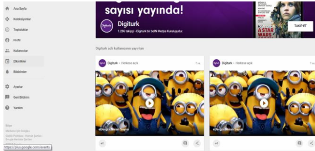
Şekil 6: Digiturk Google+ ekran görüntüsü

Takipçi sayısı doğrultusunda büyük bir hedef kitleye iletilen ürün içeriği hakkındaki iletiler ve satış artırıcı paylaşımlar sık güncellenebilme özelliğine sahiptir. Sosyal ağlar kanalıyla dijital TV platformları kendi müşterilerinin özellikle üzerinde durduğu konuları, memnuniyet düzeyleri ve şikayet konularını anında öğrenebilme şansına sahiptirler. Bu durumda kurumun sosyal medya editörleri aracılığıyla şikayetler anında dikkate alınmakta ve şikayetlerin çözüme ulaştırılması hız kazanmaktadır. Ayrıca sosyal medyada ve YouTube, Facebook, Twitter, Instagram ve Wikipedia gibi İnternet sitelerinde kullanıcının içeriğe olan artan ilgisiyle birlikte, tüketicilerin işletmeler tarafından hazırlanan pazarlama içeriğine aktif olarak katkı sağladıkları görülmektedir (Heinonein, 2011: 356).