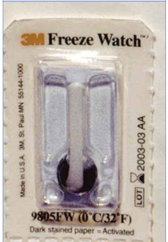
Resim 2. Donma izlemcisi

doğrudan değmesi yine donmaya yol açabilir. Aşı ile buz aküsü arasında karton kutu koyarak donmanın engellemeye çalışılması da yeterli olamamaktadır (11). Bu nedenle de