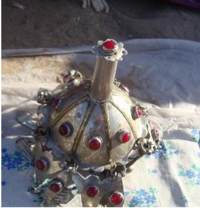
Fot.9: Gupba, Aşkabat Çöl Pazarı,S.Kılıç-2010

Eksen haçının ana noktaları ve çapraz haçın dünya kenarları yıllık döngünün dört ana fazını temsil eder (4+4). Bunlar dört mevsimle ve günün dört ana fazı olan, sabah, öğle, akşam ve gece ile alakalandırılır. Gülyaka takısı, köken itibarıyla dört yön sekiz bucak kavramının karşılığı olmakla beraber, halk arasında güneş ışıklarının parlak görünümünün karşılığı olarak kabul edilmesi nedeni ile Güneş'in sembolü olarak anılmaktadır. Ancak yapılan geniş ölçekli literatür araştırmaları, tespitleri ve analizleri gereğince; Gülyaka takısının, kompozisyon şeması itibarı ile, iki türü mevcuttur. Türlerden biri, yer ve yön kavramına ilişkin referansları içeren eksen ve çapraz haç şemasına sahip iken, diğer türde ise, tıpkı güneş gibi merkezden genişleyerek yayılan ışınları temsil eden akik taşları takının yüzeyine konumlanmıştır.