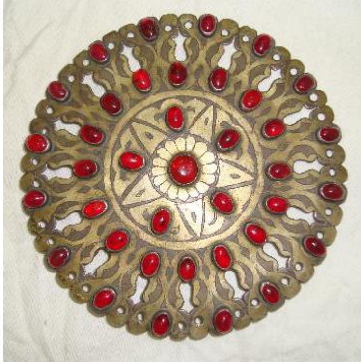
Fot.10: Gülyaka, Türkmenistan Baş Milli Müzesi Özel Koleksiyonu, S.Kılıç