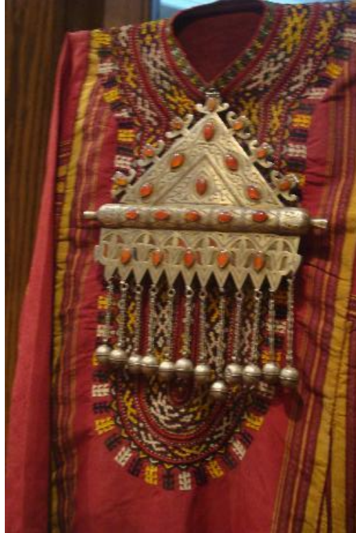
Fot.2: Aşkabat Milli Müzesi, Tumar, S.Kılıç

Aşağıdaki Tumar örneği daha karakteristik ve dolaysız bir muska örneği olup büyüsel objeler ve koruyucu ayetler, çift katlı olarak tasarlanan Tumar'ın iç kısmına yerleştirilir.