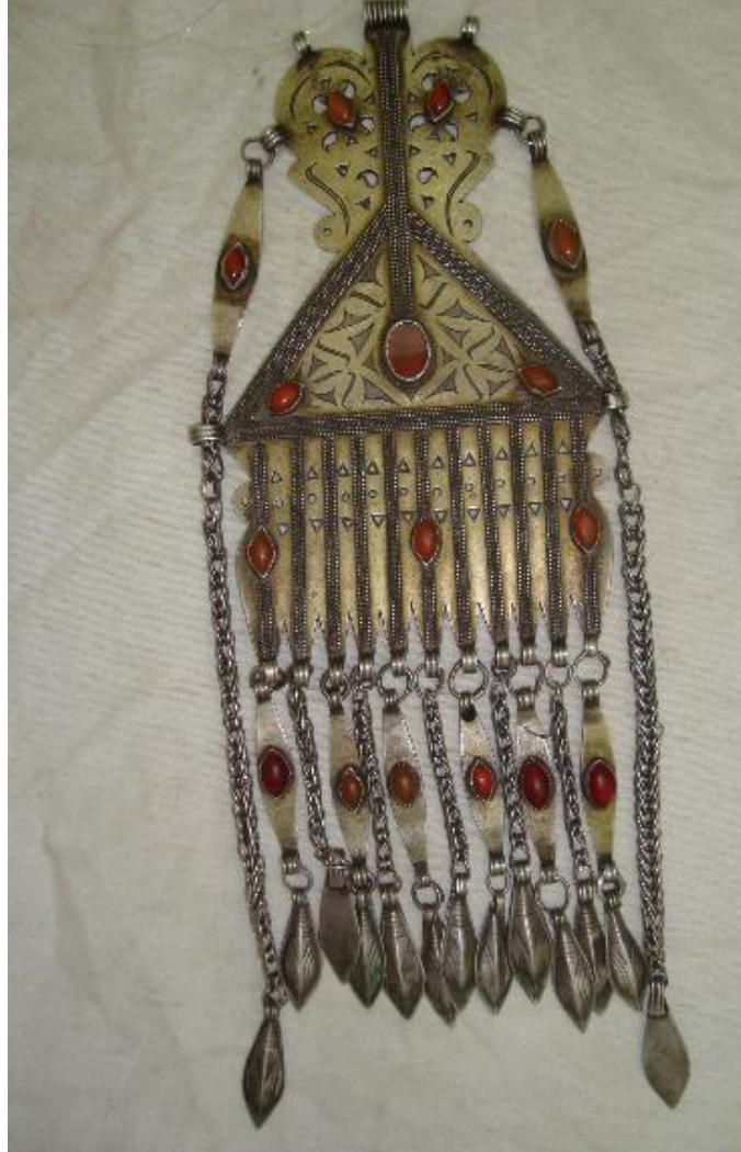
Fot.3:Enselik, Türkmenistan Milli Müze Koleksiyonu, S.Kılıç, Temmuz 2011

Dikey bir doğrultuda ensede ve şakaklarda uzanan bu takıların merkezinde yer alan üçgen şema, sayısız ek koruyucu biçim ve öğelerle baş bölgesini tehlikelere en açık yan ve arka taraflarını koruma altına alır. Ayrıca, üçgen bölgenin yer aldığı şaman simgesinin üzerinde dikey doğrultuda yer alan üç akik taşının bulunması bu sayıya yüklenen tılsımlı özelliklerden maksimum düzeyde faydalanılmasını sağlar.