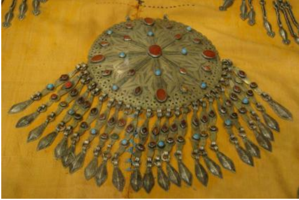
Fot.8: Şalpele Gülyaka, Aşkabat Çöl Pazarı,S.Kılıç-2010

Dokuz sayısı ise, eksen haç ve çapraz haçın bileşkesinden oluşur. Bu oluşun sekiz üçgen ve merkezinden oluşan kısım, dokuz sayısını meydana getirir. Orta Asya Türk baş takılarının genel kompozisyon şeması, çapraz ve eksen haç üzerine şekillenmiş olup, merkezi bir noktada birleşmiştir. Türk zaman ve mekân algı sisteminde zaman gözlemi, sabit bir noktadan yapıldığı için bu nokta dünyanın merkezi olarak kabul edilmiştir. Buna bağlı olarak, Türkmen ve Orta Asya Türk topluluklarına ait takılarda süsleme ve biçimlendirme unsurları, beşli ve dokuzlu kompozisyon şemasına bağlı olarak organize edilmişlerdir. Beşli merkezi dizilim pusulanın dört ana yönü ile, bulunulan sabit konumun bileşiminden ibarettir. Keza dokuzlu merkezi dizilim ise, pusulanın ana ve ara yönleri ile yine sabit noktaya işaret eder. Beşli ve dokuzlu dizilime Gupba ve Asık takılarında sık rastlanmakla birlikte aynı zamanda Gupba takısına da bir başka ifade olarak, sekizli dizilim artı merkez, dünyanın sekiz köşesine işaret etmektedir. Belirtildiği üzere Türk dünya algısında, dünya, dört yön, sekiz köşeden (bucak) oluşmaktadır. Pusulanın ara yönlerinin her birisi, dünyanın dört köşesini kırk beş derecelik açılarla ikiye bölerler.