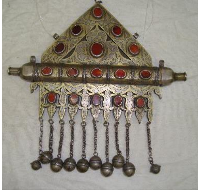
Fot.1: Tumar, Türkmenistan Milli Müzesi Koleksiyonu, S.Kılıç, Temmuz 2011

Aşağıdaki Tumar örneği daha karakteristik ve dolaysız bir muska örneği olup büyüsel objeler ve koruyucu ayetler, çift katlı olarak tasarlanan Tumar'ın iç kısmına yerleştirilir.