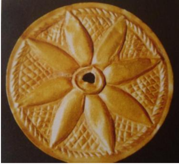
Fot.5: Margiana'dan lotus motifli süsleme parçası (V.Sarinadi)

Bahsi geçen bu formülize yapı, daha öncede ifade edildiği üzere sadece Türkmen takılarına değil, tüm materyal kültür birikimlerine yansımış olup, oradan da Anadolu'ya kadar uzanarak, hemen hemen tüm geleneksel motiflerde bölgesel isim farklılıklarıyla hayat bulmaya devam etmiştir.