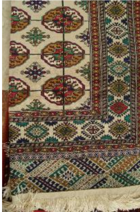
Fot.7: Klasik Türkmen Halısı Motifi

Bahsi geçen bu formülize yapı, daha öncede ifade edildiği üzere sadece Türkmen takılarına değil, tüm materyal kültür birikimlerine yansımış olup, oradan da Anadolu'ya kadar uzanarak, hemen hemen tüm geleneksel motiflerde bölgesel isim farklılıklarıyla hayat bulmaya devam etmiştir.