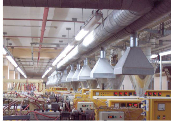
Şekil 1. Genel havalandırma sistemi [15].

Gaz, duman vb kirleticilerin temiz hava akımı ile atölye içine dağıtmak ve daha sonra ters yönde veya tavandaki emme ağızları ile dışarı atma esasına dayanmaktadır. Bu yöntemin işyerlerinde kullanımı ile belli bir dereceye kadar kirleticiler dağıtılabilir. Bu yöntem kullanılması sonucunda kirlenme kaynağın uzağındaki kişiler olumsuz etkilenebilmektedir. Genel havalandırma yönteminde bir atölye yüzölçümü için 50 m 3 /h hava değişimi öngörülmektedir [14]. Şekil 1' de genel havalandırma sistemi gösterilmektedir.