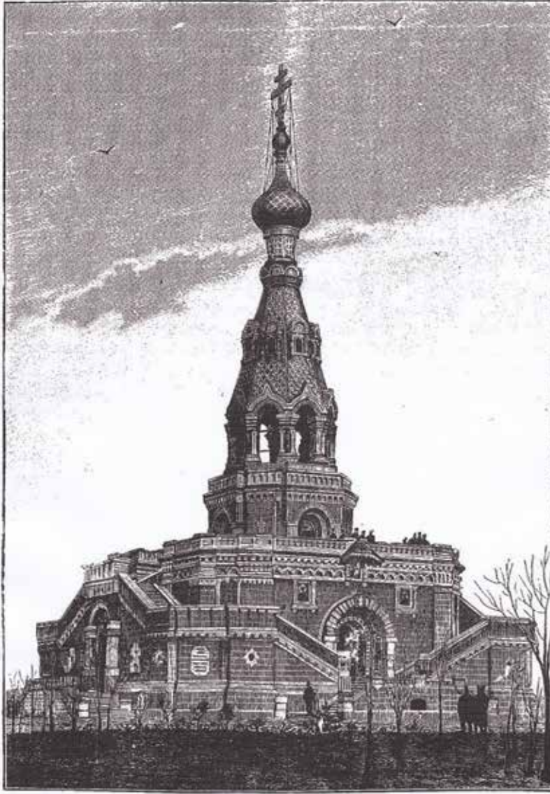
Храмъ-усыпальница русскихъ воиновъ, павшихъ въ русско-турецкую войну 1877-78 г., близъ Салъ-Стефано. По фот. грав. Рашевскій.

Fotoğraf 3 - Tamamlanan anıtın Raşevskiy imzalı foto-gravürü (Niva, 9 Ocak 1899) / Photo-engraving of the monument by Rashevsky (Niva, 9th January 1899)