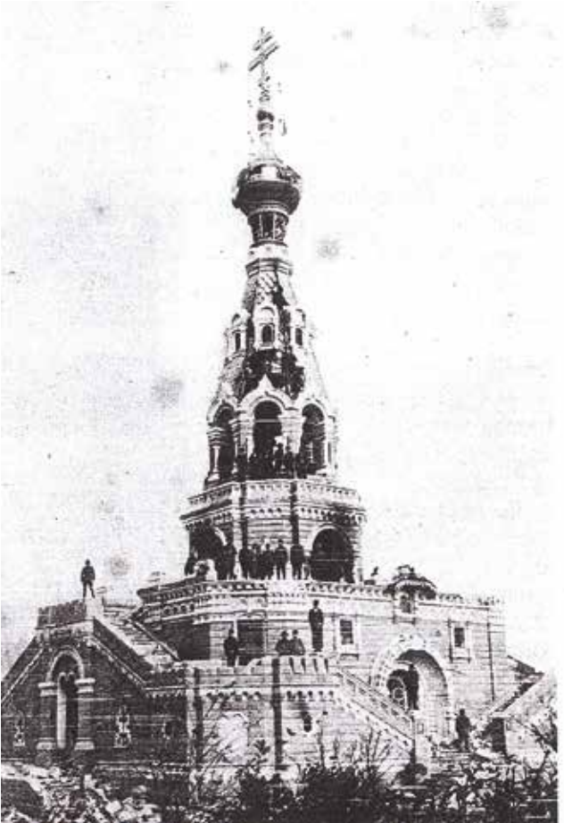
Fotoğraf 7 - Ali Enis Bey'in yıkım başlangıcında çektiği fotoğraf (Margulies 1994: 41) / A photo by Ali Enis Bey before the demolition (Margulies 1994: 41)