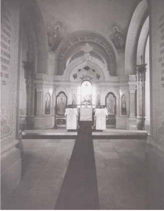
Fotoğraf 6 - Anıtın içindeki kilise (Başgelen 1998: 73) / The church inside the monument (Başgelen 1998: 73)