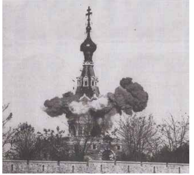
Fotoğraf 8 - Anıtın yıkılış aşamaları (Başgelen 1998: 74-75) / Demolition stages of the monument (Başgelen 1998: 74-75)