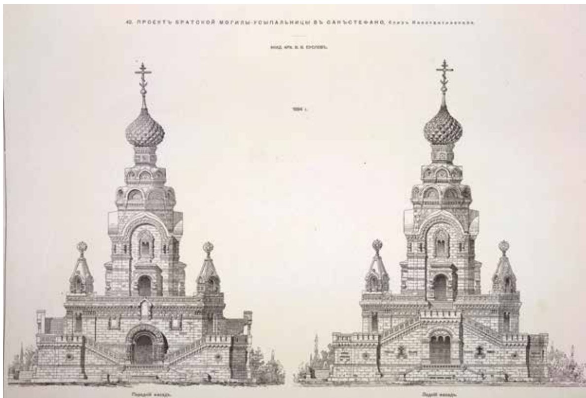
Şekil 2 - Suslov'un projesi: Ön ve arka cepheler (Baranovskiy 1902: 488) / Suslov's project: Front and rear facades (Baranovsky 1902: 488).