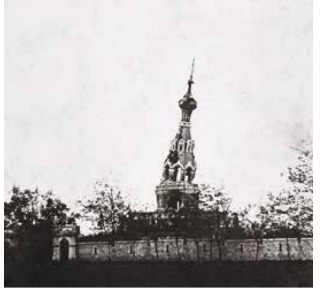
Fotoğraf 9 - Anıtın yıkılış aşamaları (Başgelen 1998: 74-75) / Demolition stages of the monument (Başgelen 1998: 74-75)