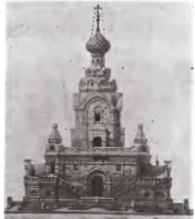
Fotoğraf 11 - Anıtın yıkılışından sonra Niva dergisinde yayınlanan bir foto-gravür (Niva, 29 Kasım 1914) / A photo-engraving, published in Niva journal after the demolition of the monument (Niva, 29th November 1914)

Bugün metruk bir alan halindeki arazide 2008 yılında incelemelerde bulunan Rus tarihçi S. V. Kapustin ise, yıkılan anıta dair bazı izler bulduğu kanaatindedir. Kapustin'e göre, eskiden anıtın konumlandığı noktada bugün derin bir çukur mevcuttur ve çukurda, yapının temellerinin izlerini de görmek mümkündür.