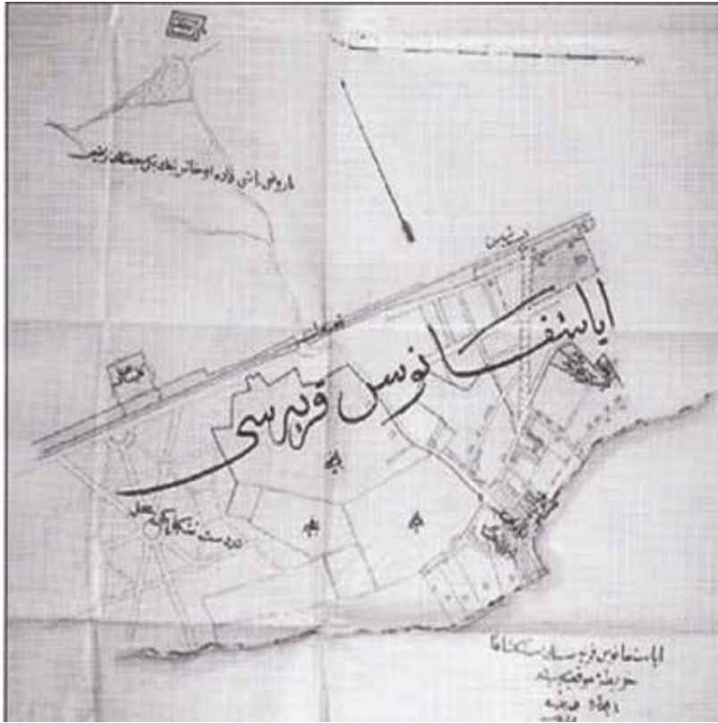
Şekil 4 - 10 Recep 1307 (2 Mart 1890) tarihli Ayastefanos karyesi haritası (Başbakanlık Osmanlı Arşivi Y.A.HUS d. 247 g. 92) / A map of Ayastefanos dated 10 Recep 1307 (2nd March 1890) (Prime Ministry Ottoman Archives Y.A.HUS d. 247 g. 92)