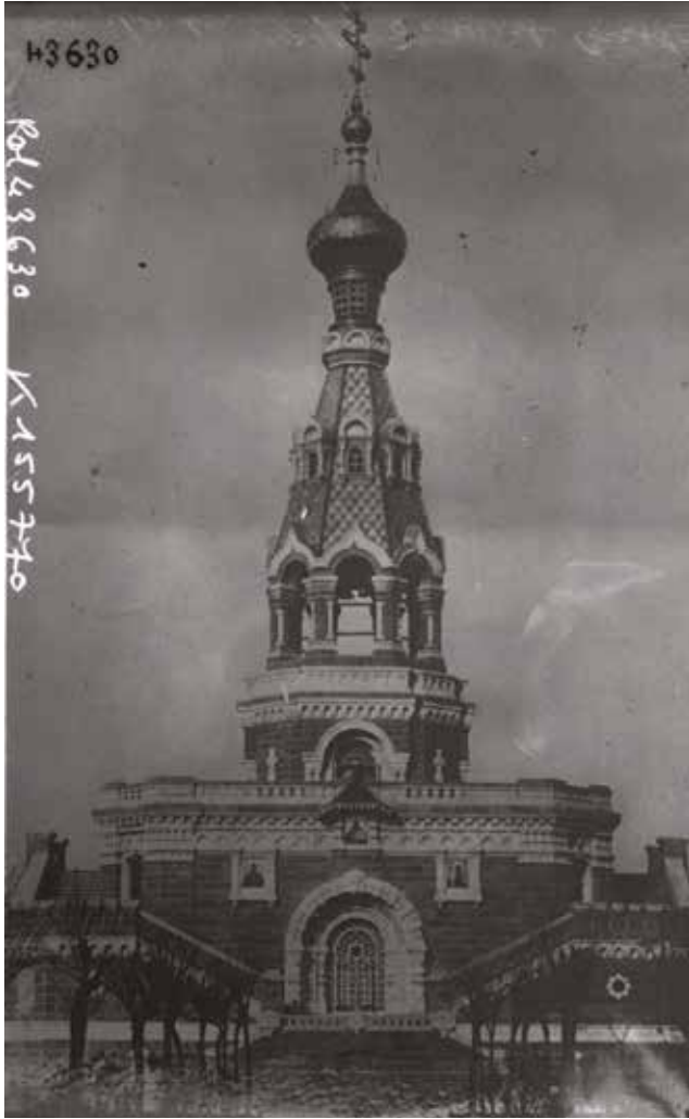
Fotoğraf 5 - Anıtın bir fotoğrafı (Gallica/ Bibliothèque nationale de France) / A photograph of the monument (Gallica/ Bibliothèque nationale de France)

Makalede, bir şapel ile birlikte üç katlı olan yapının, 20 kulaç kadar kare bir alanı kapladığı, yüksekliğinin ise 22 kulaçtan fazla olduğu belirtilir.