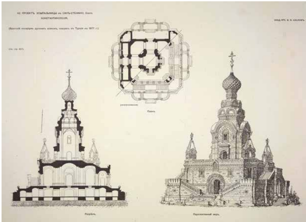
Şekil 1 - Suslov'un Ayastefanos'ta inşa edilecek anıt projesi için hazırladığı ilk çizimler: Plan, kesit ve perspektif çizim. (Baranovskiy 1902: 487) / Suslov's sketches for the monument at Ayastefanos: Plan, section and perspective drawing (Baranovsky 1902: 487)