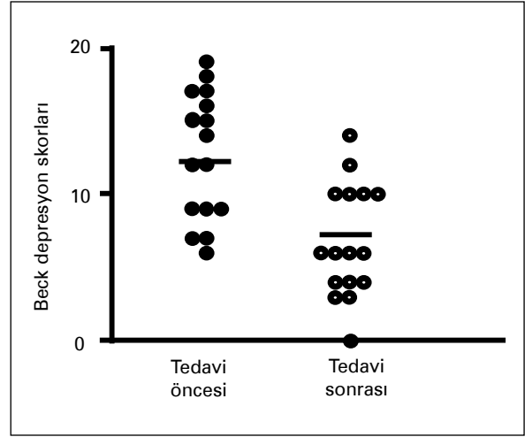
Şekil 1. Tedavi öncesi ve sonrası BDÖ puanları.

Tüm istatistiksel analizler SPSS for IBM-PC (SPSS inc.) paket programında gerçekleştirilmiştir. Gruplararası karşılaştırmalar, eşleştirilmiş gruplar için Wilcoxon testi ile yapılmıştır. Korelasyon analizi Pearson testi ile değerlendirilmiştir. P değeri 0.05'ten küçük bulunan değerler istatistiksel olarak anlamlı kabul edilmiştir.