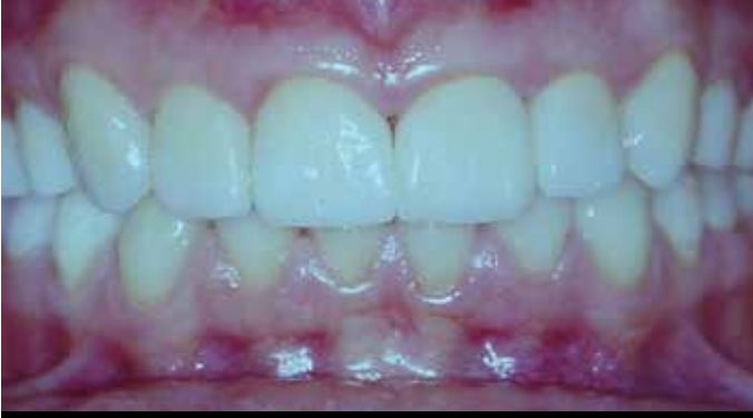
Resim 5. Final restorasyonlarının frontal görüntüsü