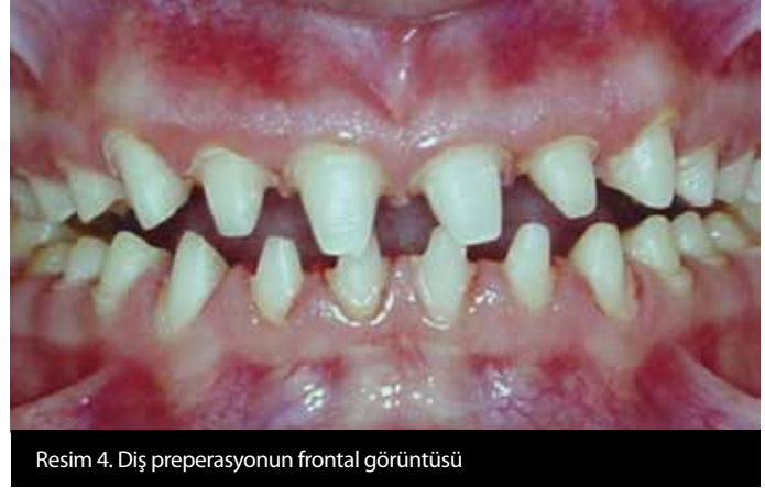
Resim 4. Diş preperasyonunun frontal görüntüsü

mızı-kahverengi renklidir (6). Hipokalsifiye tipte mine nispeten normal şekillenmiş, ancak mineralizasyon zayıftır. Dişler sürdükten kısa bir süre sonra mine dentinden ayrılmaktadır. Hipokalsifiye mine ve açığa çıkan dentin çevresel faktörlerle kolayca boyanır; dişlerde sarı-kahverengi bir görünüm olur. Hastalarda diş hassasiyet şikayeti mevcuttur (10, 11). Son grupta hipomatür-hipoplazi tiplerin kombinasyonu şeklinde görülür (5). Dişlerin vestibül yüzeylerinde çok sayıda beyaz-sarı benekli lekeler veya kahverengi küçük dişler görülebilmektedir. Proksimal kontaklar olmayabilir.