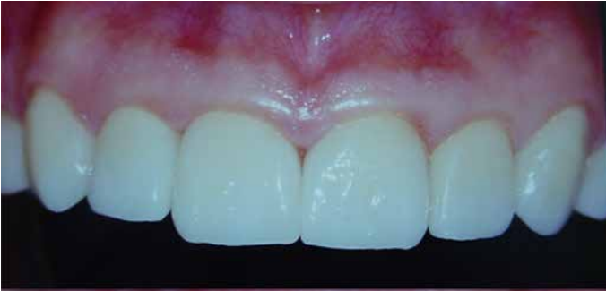
Resim 6. Hastanın 5 yıllık takip görüntüleri