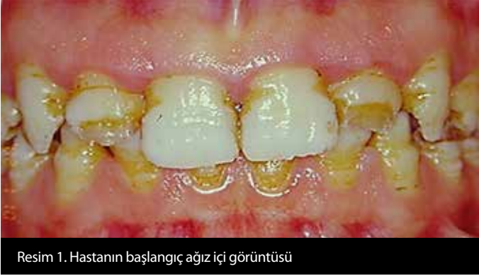
Resim 1. Hastanın başlangıç ağız içi görüntüsü