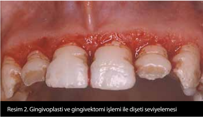
Resim 2. Gingivoplasti ve gingivektomi işlemi ile dişeti seviyelemesi