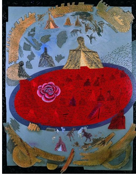
Görsel 3. “İsimsiz”, Erol Akyavaş, Tuv. Üzr. Yağlıboya, 110x70 cm.

“Dini semboller, geleneksellik temaları, hat sanatından, minyatürden seçtiği semboller, Akyavaş’ın resimlerinde biçimsel anlamda temaların zenginliğini ifade ederken, içerik olarak da bu sembollerin oluşturduğu metafizik bir dünyanın anlamlarını çağrışırlar. Bu bakımdan Akyavaş’ın sanatını özgün kılan önemli nedenlerden biri de doğu ve batı tema ve geleneklerini karıştırarak yeni bir sentez oluşturmasıdır ” (Schmied, 2000, s. 13).