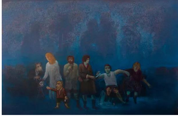
Görsel 5. "Kendi Hakikatinin Peşinde", Tuv. Üzr. Yağlıboya . 70x120 cm.