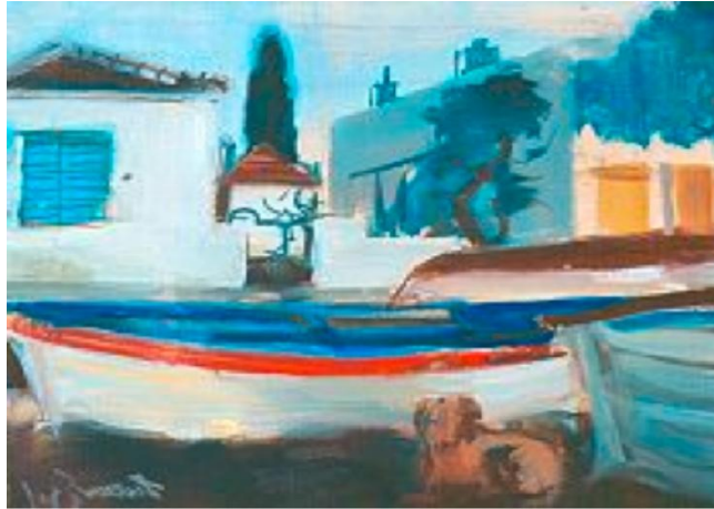
Görsel 7. "Kayık ve ev", Turan Erol, Tuv. Üzr. Yağlıboya . 65x85 cm.

Farklı olgular, farklı çabalar, şehirleşmenin farklı boyutlara gelmesi ve şehirleşme ve kültürel, sanatsal eğitim ve anlayış noktasında bile, Türk kültürünün ve sanatçısının farklı bir kimlik ve kişiliğe sahip olduğu gerçeği bizlere sunmuştur.