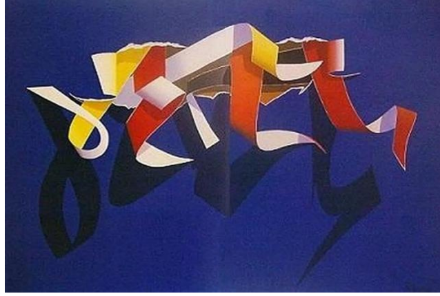
Görsel 6. "İsimsiz", Burhan Doğançay, Tuv. Üzr. Yağlıboya . 80x130 cm.