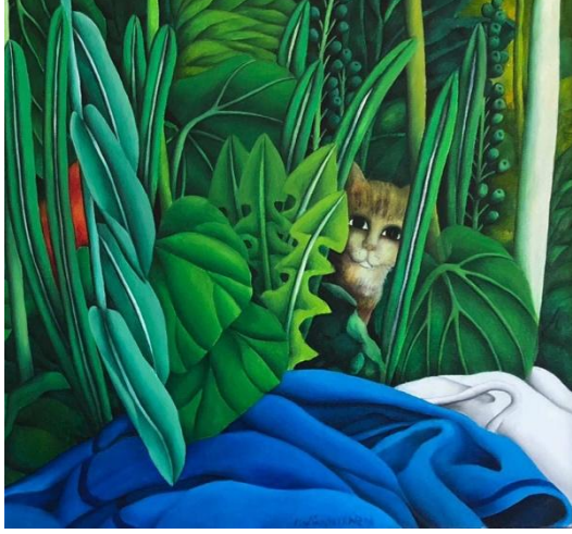
Görsel 4. “İsimsiz”, Nadide Akdeniz, Tuv. Üzr. Yağlıboya. 110x110 cm.

Türk sanatındaki dönüşüm formuna bakıldığında, özellikle modernlik algılamaları ve halk sanatı gerçekliği, sanatçılarımızı da etkilemiş, onlar batı sanatının izinde kendi özgün kimliklerini ararken, bir sentezin gerekli olduğunu kavramışlardır. Sorun bu sentezi gerçekleştirirken, özgün bir kişisel kimlik nasıl ortaya çıkaracakları noktadadır ki, sanat da özgünlük ve kimlik sorunsalı çözülmeden gerçekleştirilemez.