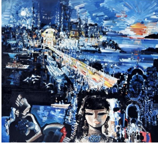
Görsel 1: "İstanbul", Şadan Bezeyiş, Tuv. Üzr. Yağlıboya, 120x120

Sabri Berkel'in soyutlamaları ve soyuta atıfla oluşturduğu kompozisyonları yine kendi gelenek formundan beslenerek dönüştürülmüş öğeler olarak karşımıza çıkmaktadır. Empresyonist Türk ressamı gibi, Türk Soyutçuları da Batı sanatından etkilenerek, kendi kültürleriyle sentezlere gitmişler ve özgün yaratı alanları geliştirmişlerdir... Bu da Türk resmi, özellikle Türk Soyut Resmi için çok büyük bir kazanımdır.