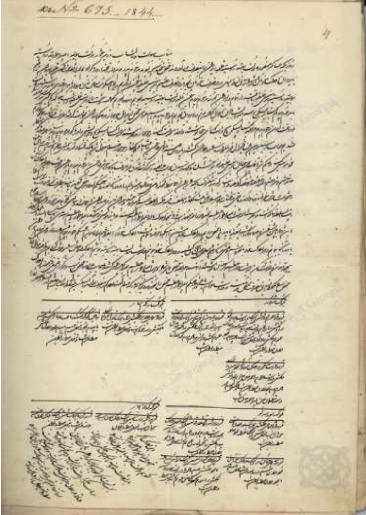
Ek 1: Mehmed Hasan Han'ın Farsça Mektubu