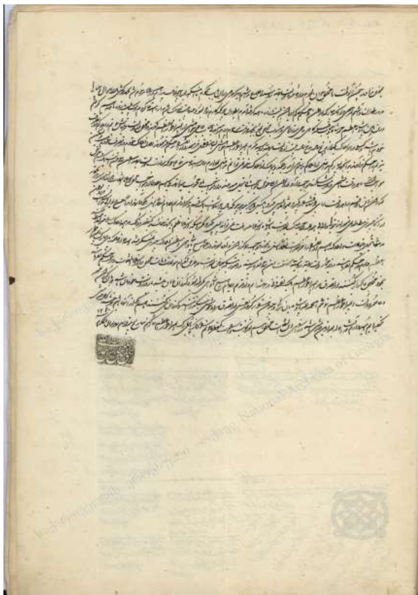
Ek 2: Mehmed Hasan Han'ın Farsça Mektubu