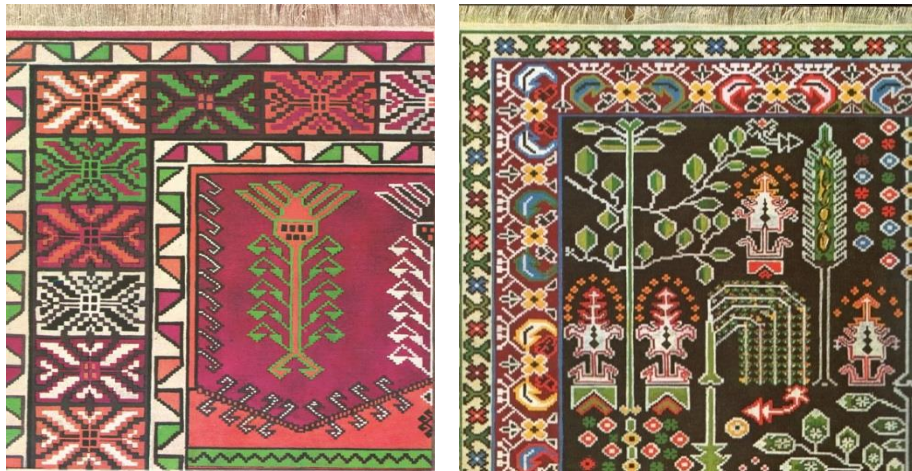
Fotoğraf 29: Niğde yöresi, hayat ağacı motifli halı detayı, Taşpınar, Nazmiye Metin dokuması, (Durul, 1997: 32), Fotoğraf 30: Niğde yöresi servili halı detayı. (Durul, 1997: 34).

(Fotoğraf 28) Malatya yöresine ait halıda hayat ağacı formu orta zeminde üç bölüm olarak ayrılan dikdörtgen formlar içerisinde stilize bir üslupla tasarlanmıştır. Elibelinde motifi ile bölümlere ayrılan hayat ağacının sol ve sağ taraflarına göz motifi oluşturulmuştur. Halının tüm çevresinde yer alan bordür kısmında ise bereket ve su yolu motifleri ile çerçevelenmiştir (-Katalog 5, 2006: 0526).