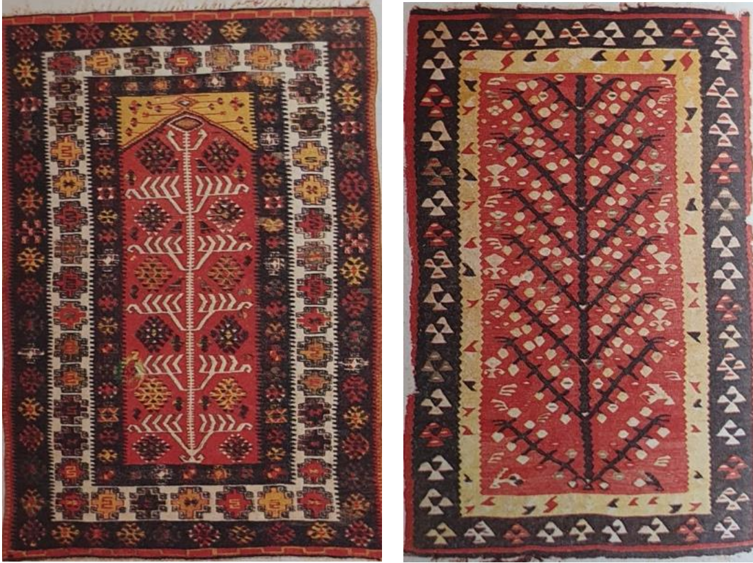
Fotoğraf 13: Türk ve İslam Eserleri Müzesi, (Erbek, 1987: 50). Fotoğraf 14. Vakıflar Halı Müzesi, (Erbek, 1987: 50).

(Fotoğraf 14) Tekirdağ bölgesine ait bir başka kilim örneğinde orta zeminin tüm yüzeyinde hayat ağacı motifinin merkezi kompozisyonu oluşturduğu ve çevresinde geometrik desenli bordürlerle çerçevelendiği görülmektedir.