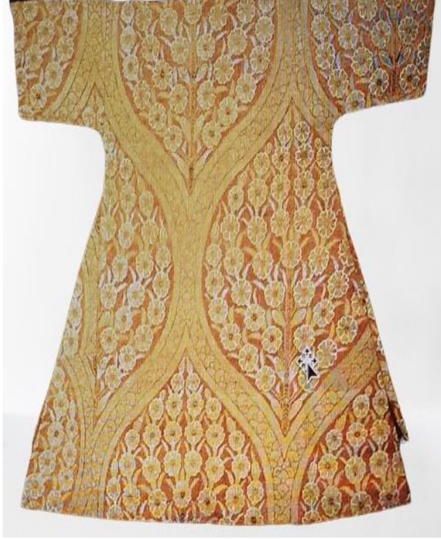
Fotoğraf 4: 1.Ahmet'in çocukluk kaftanı kemha kumaş, 16. yüzyıl sonu, TSM. 13/967, (Salman, 2011: 126).

(Fotoğraf 4) TSM. bulunan 16. yüzyıl son dönemine ait 1. Ahmet'in çocukluk kaftanı, kemha kumaştan oluşturulmuştur. Madalyonların içerisinde simetrik olarak tasarlanan ilkbahar çiçekleriyle ve dallarıyla donatılmış, ağaç figürü görülmektedir. Bu desenlendirme 16. Yüzyılın ortalarında Kanuni Sultan Süleyman döneminde nakkaş başı Karamemi tarafından tasarlanmıştır. Kemha kumaşın nadir ince bir örneğidir. Olağanüstü dokuma tekniğinde oluşturulan kumaşa malzeme olarak; yün, ipek, altın, gümüş ve metalik iplikler kullanılmıştır (Gürsu, 1988: 84).