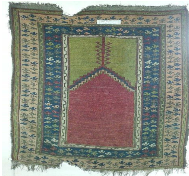
Fotoğraf 24: 18.yüzyıl, Kavak yöresi halısı hayat ağacı Envanter No 11377/460 (İzzet Koyunoğlu Müzesi, Konya).

(Fotoğraf 24) Konya bölgesi kavak yöresine ait halı örneğinde hayat ağacı motifi iki ana bordürden sonra orta zeminde mihrap üzerinde stilize bir üslupta yer almaktadır. Orta zemini çevreleyen bordürlerde de bitkisel formlar kullanılmıştır.