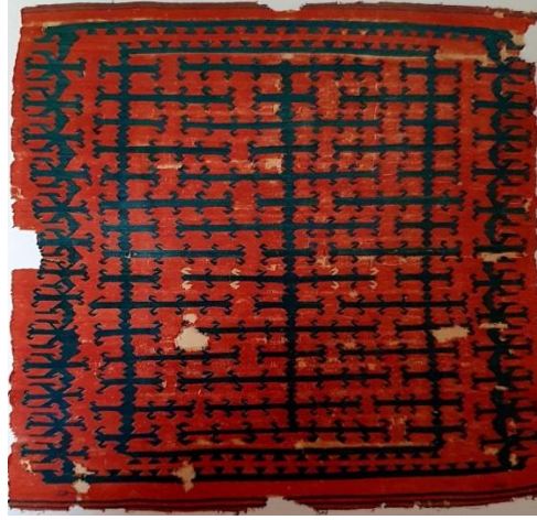
Fotoğraf 15: 18. yy. 135x160 cm. Vakıflar Halı Müzesi, Envanter No: 8171, (Erbek,1988: 18).

(Fotoğraf 16) 18. yüzyıl Gümüşhane, Bayburt yöresi kiliminde orta zeminde mihrap içi ve dışında hayat ağacı motifinin farklı stilize edilmiş kompozisyonları görülmektedir.