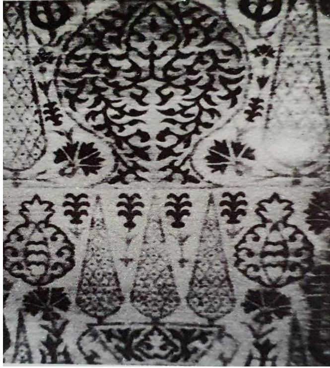
Fotoğraf 11: Çatma kumaş, 18. yüzyıl ikinci yarısı, Victoria and Albert Müzesi, 98-1878, (Gürsu, 1988: 156).

(Fotoğraf 12) 17. yüzyıl sonuna ait kemha kumaşta dilimli madalyon motifi kullanılmıştır. İçlerinde paralel olarak düzenlenmiş servi (çam) ağacı motifleri yer almaktadır. Dokumada gümüş metalik, yün ve ipek iplikleri kullanılmıştır (Gürsu, 1988: 135).