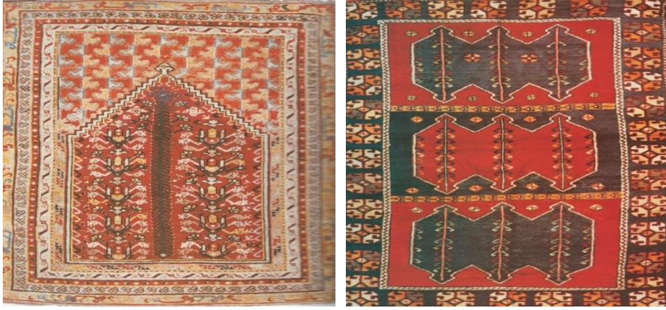
Fotoğraf 27: 19 yy. Manisa -Kula halısı, 132x193 cm., (Turkish Handwoven Carpets, Katalog 5, 2006: model no 0593)., Fotoğraf 28: 19 yy. Malatya halısı, 100x200cm., (Turkish Handwoven Carpet, Katalog 5, 2006: model no 0526).

(Fotoğraf 27) Manisa bölgesi Kula yöresi halısında mihrap içerisinde stilize üslupla hayat ağacı motifi tasarlanmıştır. Mihrabın üzerinde koç boynuzu motifi bulunmaktadır. Çevresinde bitkisel motifler ve bordürde su yolu motifi ile çerçevelenmiştir (-Katalog 5, 2006: 0593). Kula halıları aynı zamanda mihraplı kompozisyonları ile dönemin en ihtişamlı grubunu (tek mihraplı ve çift mihraplı) oluşturmaktadır (Anmaç, 1999: 16).