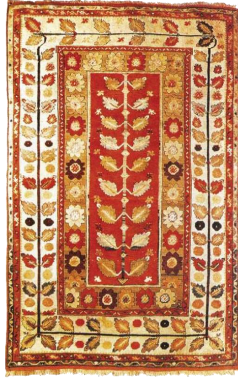
Fotoğraf 25: 19. yzyıl, Hereke ipek seccade hayat ağacı, Moskova Şark Sanatları Devlet Mzesi, (Nekrasova, vd. 1997). Fotoğraf 26: Milas halısı hayat ağacı motifi, model no: 0123.

(Fotoğraf 26) Milas halısı örneğinde hayat ağacı motifi ttn yapraklarından oluşan orta zemin ve halıyı çerçeveleyen tm bordr blmnde natralist slupta kullanılmıştır (Balcı, 2012: 45-46). Milas halılarının önemli bir özelliđi de Trkmenler tarafından 11. yzyılda blgeye getirilmesidir. Bu durumun sonucu olarak halıcılık geleneđinin yre kltr ile birleřtirilip harmanlanması ve beraberinde kendine özg renk, motif biimlerinin ortaya ıkmasına neden olmuřtur (Etikan ve lmez, 2018: 547).