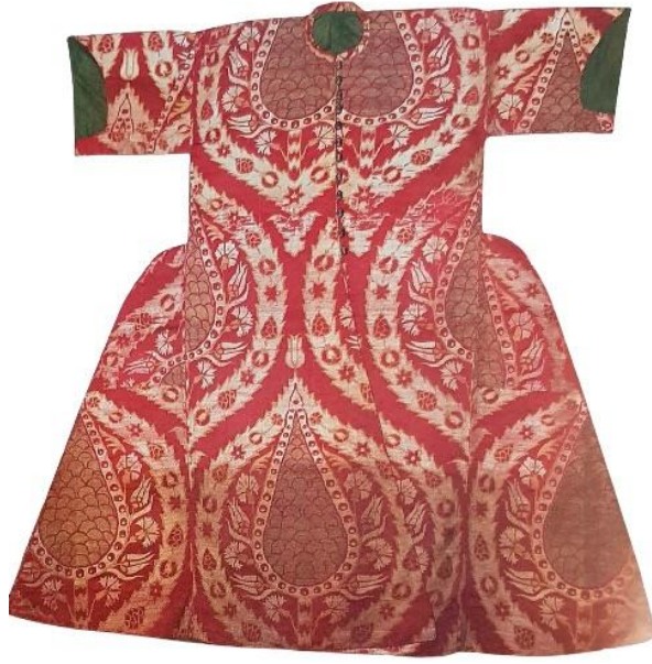
Fotoğraf 5: 1.Ahmet'in çocukluk kaftanı kemha kumaş, 17. yüzyıl ilk yarısı, TSM. 13/216, (Salman, 2011: 127).

(Fotoğraf 6) TSM. de bulunan 15X15 cm. olan bölüm kemha kumaş bir bohçaya aittir. Tekli madalyon içerisinde realistik (gerçeğe uygun) palmye ağacı tasarımı yer almaktadır. Ana zeminde yakut renkli iplikler ve desenlerde yaldızlı metalik iplikler kullanılmıştır (Gürsu, 1988: 114-115).