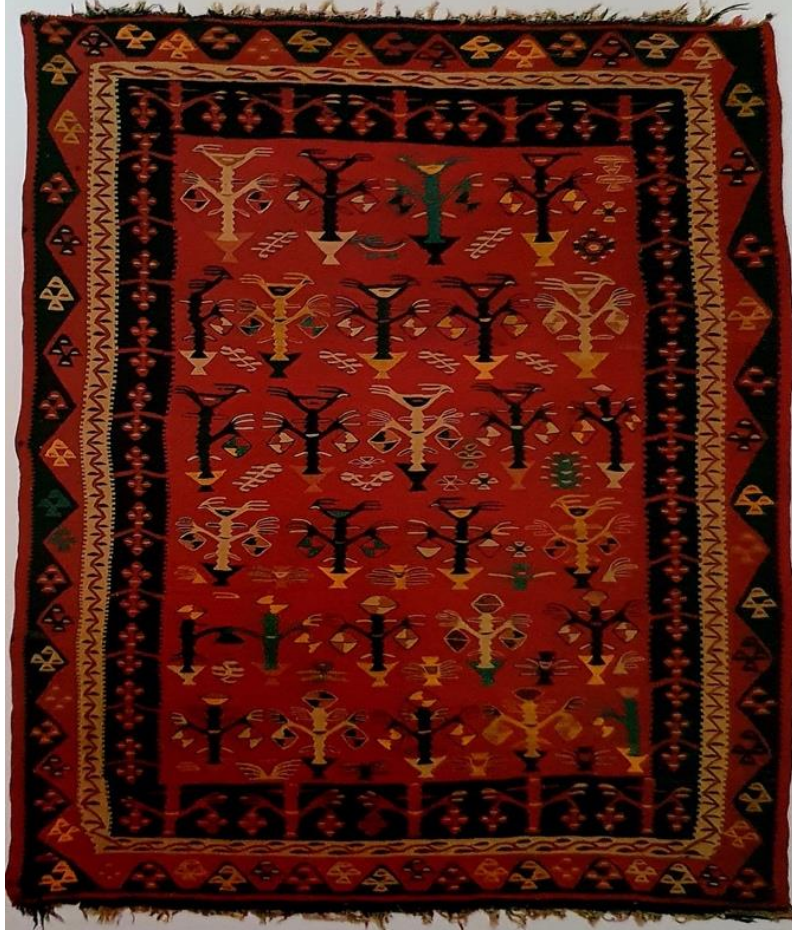
Fotoğraf 18: 18.yüzyıl, 185x265 cm. Etnegrofyta Müzesi, Envanter No: 16349, (Erbek,1988: 96).

(Fotoğraf 18) 18. yüzyıla ait Tekirdağ, Şarköy yöresi kilim örneğinde tüm orta zeminde stilize hayat ağacı motifi ve insan ömrünü sembolize eden bu motifle birlikte kuş teması kullanılmıştır. Ağacın üzerindeki kuşlar her an uçabilecek şekilde tanımlanmış olup ejderha motifi ise hayat ağacını koruyucu nitelikte kullanılmıştır (Erbek, 1988: 96).