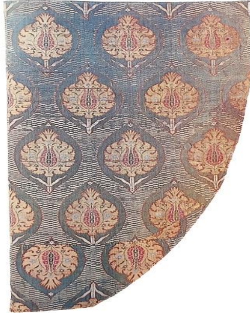
Fotoğraf 8: Kemha kumaş, 17. yüzyıl ilk yarısı, Keir koleksiyon, (Gürsu, 1988: 123).

(Fotoğraf 8) 17. yüzyılın ilk yarısına ait olan kemha kumaş örneğinde oval madalyonlarla birlikte tüm zemin üzerinde stilize hurma ağacı ile tasarlanmıştır. Dokumada yün, ipek ve metalik iplikler kullanılmıştır (Gürsu, 1988:115).