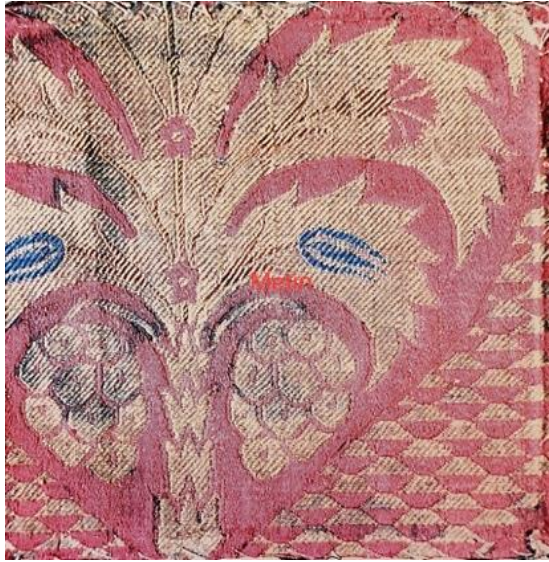
Fotoğraf 6: Kemha kumaş, 17. yüzyıl ilk yarısı, TSM. 13/1740, (Gürsu, 1988:123).

(Fotoğraf 6) TSM. de bulunan 15X15 cm. olan bölüm kemha kumaş bir bohçaya aittir. Tekli madalyon içerisinde realistik (gerçeğe uygun) palmye ağacı tasarımı yer almaktadır. Ana zeminde yakut renkli iplikler ve desenlerde yaldızlı metalik iplikler kullanılmıştır (Gürsu, 1988: 114-115).