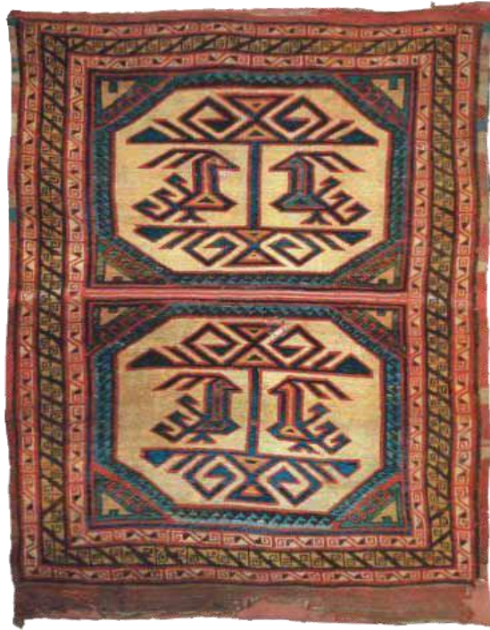
Fotoğraf 22: Marby halısı, 15. yüzyıl, İsveç-Stockholm, Stantens Historisca Müzesi. Envanter No: 17786. (İnalçık, 2008: 38).

Anadolu Türk halılarının çoğunda görülen kare içinde çokgenle gösterilmiş düzenlemede merkez vurgulaması yapılarak dünyanın eksenini ifade eden “dünya ağacı” üzerindeki kuşlarla betimlenmiştir (Çoruhlu,2016: 114). Dünya ağacında farklı hayvan-sal figürlerinde kullanıldığı örnekler mevcuttur. Ayrıca karenin dört kısmında yer alan üçgen boşluklarda muska motifine benzetilmektedir (Çoruhlu, 2015: 248-249).