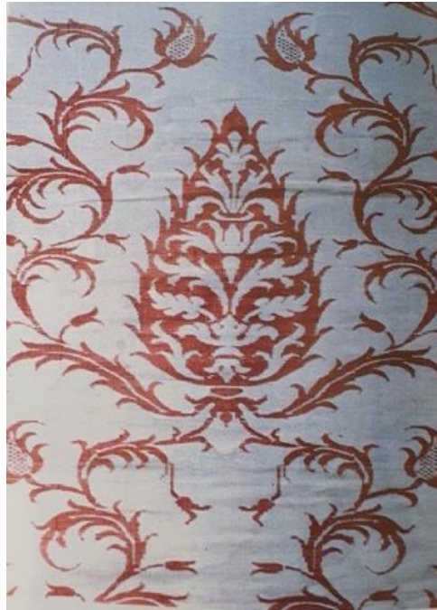
Fotoğraf 10: İpek şalvar, 18. yüzyıl ikinci yarısı, TSM.,13/571, (Gürsu, 1988: 170).

(Fotoğraf 10) 17. yüzyıl Sultan 1. Mahmut'a ait ipekli şalvar, zeminde krem renk ve açık kırmızı renkte servi motifi ve barok tesirli yaprak dolgular yer almaktadır. Servi motiflerinin iki yanında rokoko üslubunda kıvrımlı dal formları bulunmaktadır (Öz, 1951: 67).