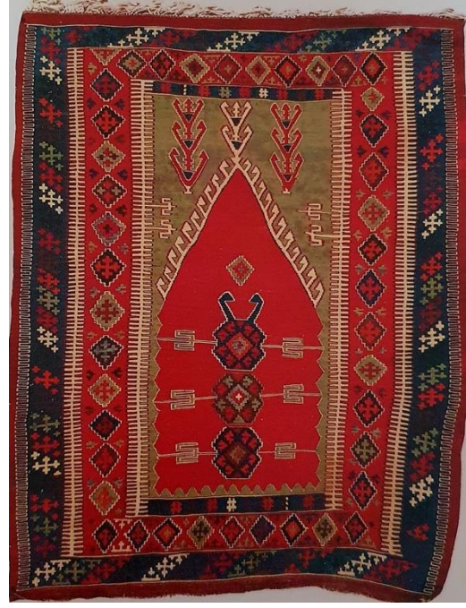
Fotoğraf 19: 19. yüzyıl, 90x160 cm., Vakıflar Halı Müzesi, Envanter No: 9122, (Erbek,1988: 78)., Fotoğraf 20: 20. yüzyıl, 140x185 cm., Türk İslam Eserleri Müzesi, Envanter No: 1713 (Erbek,1988: 81).

(Fotoğraf 21) 20. yüzyıla ait Kars bölgesinin seccade kilim örneğinde hayat ağacı üç ayrı iç bordür içerisinde farklı geometrik motiflerle düzenlenmiştir. Hayat ağacının sol ve sağ yanında ibrikler, aynı zamanda kuş, ejderha, elibelinde motifleriyle zenginleştirilmiş bir kompozisyon mevcuttur. Hayat ağacının yanındaki ibrik motifleriyle de çocuk özlemine ilişkin vurgu yapılmıştır (Erbek, 1988: 54).