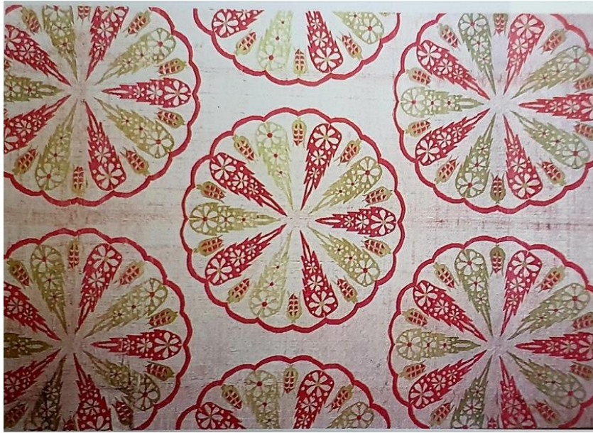
Fotoğraf 12: Kemha kumaş, 17 yüzyıl sonu, Victoria and Albert Müzesi, 835-1904 (Gürsu, 1988: 145).

(Fotoğraf 12) 17. yüzyıl sonuna ait kemha kumaşta dilimli madalyon motifi kullanılmıştır. İçlerinde paralel olarak düzenlenmiş servi (çam) ağacı motifleri yer almaktadır. Dokumada gümüş metalik, yün ve ipek iplikleri kullanılmıştır (Gürsu, 1988: 135).