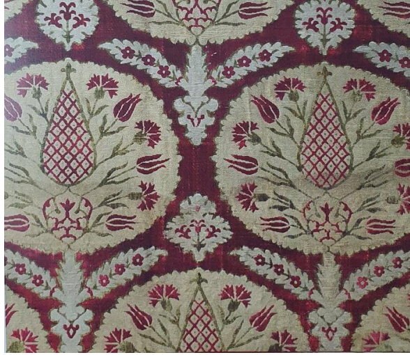
Fotoğraf 7: 17. yüzyılın ilk yarısı, Mevlâna Müzesi Konya, Env. No:597, (Atasoy, vd., 2001: 150).

(Fotoğraf 8) 17. yüzyılın ilk yarısına ait olan kemha kumaş örneğinde oval madalyonlarla birlikte tüm zemin üzerinde stilize hurma ağacı ile tasarlanmıştır. Dokumada yün, ipek ve metalik iplikler kullanılmıştır (Gürsu, 1988:115).