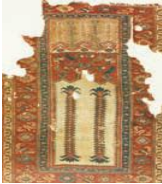
Fotoğraf 23: 17. yy Ladik halısında hayat ağacı (Türk El Dokuması Halılar Katalog 4: 1998).

zeminde mihrap nişi içerisinde iki adet simetrik hurma ağacı formunda bulunmaktadır (- Katalog 4, 1998:).