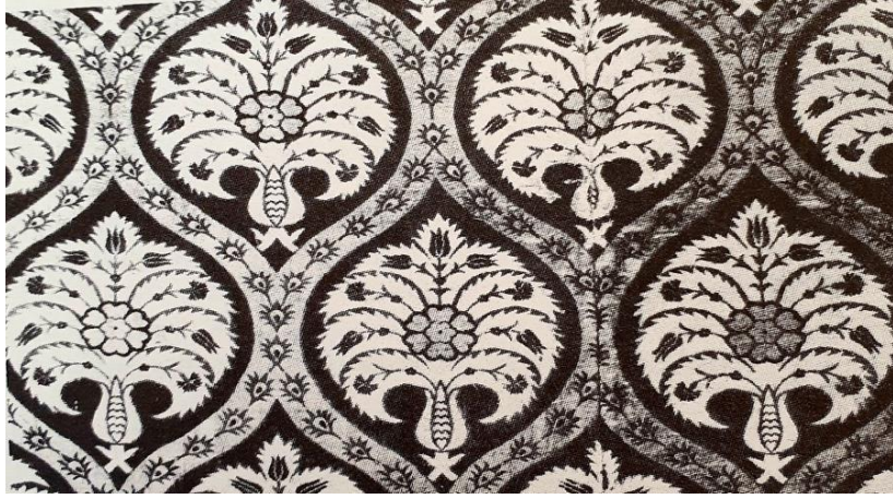
Fotoğraf 9: Çatma kumaş, 17. yüzyıl ilk yarısı, Benaki Müzesi, (Gürsu, 1988: 132).

(Fotoğraf 10) 17. yüzyıl Sultan 1. Mahmut'a ait ipekli şalvar, zeminde krem renk ve açık kırmızı renkte servi motifi ve barok tesirli yaprak dolgular yer almaktadır. Servi motiflerinin iki yanında rokoko üslubunda kıvrımlı dal formları bulunmaktadır (Öz, 1951: 67).