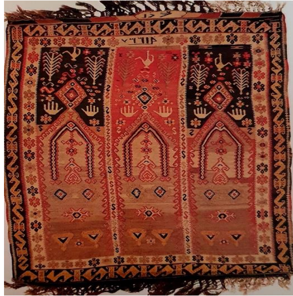
Fotoğraf 21: 20. yüzyıl, 140x185 cm. Türk İslam Eserleri Müzesi, Envanter No: 1737, (Erbek,1988: 54).

(Fotoğraf 21) 20. yüzyıla ait Kars bölgesinin seccade kilim örneğinde hayat ağacı üç ayrı iç bordür içerisinde farklı geometrik motiflerle düzenlenmiştir. Hayat ağacının sol ve sağ yanında ibrikler, aynı zamanda kuş, ejderha, elibelinde motifleriyle zenginleştirilmiş bir kompozisyon mevcuttur. Hayat ağacının yanındaki ibrik motifleriyle de çocuk özlemine ilişkin vurgu yapılmıştır (Erbek, 1988: 54).