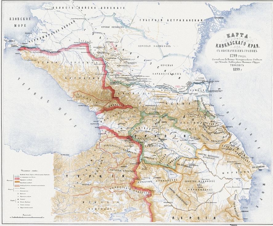
Harita 1: 19. Yüzyıl Başlarında Kafkasya