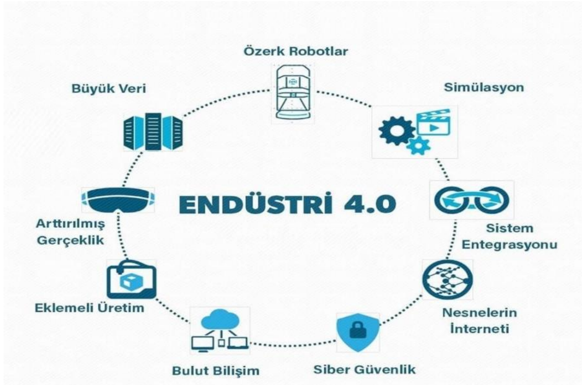
Şekil 1. Endüstri 4.0 Devrimini Oluşturan Teknolojiler (Gerbert, vd., 2015).

Birinci Sanayi Devrimi'nde, mekanik makina, İkinci Sanayi Devrimi'nde elektrik ve Üçüncü Sanayi Devrimiyle bilgi teknolojileri bu devrimlerin temel unsurlarıydı ve bu unsurlara en erken adapte olan işletmeler diğer işletmelere göre önemli rekabet avantajı elde ettiler (Günay, 2002, s. 8-14) (Esmer ve Alan, 2019, s. 466). Geçiş aşamasında olduğumuz Dördüncü Sanayi Devriminin (Endüstri 4.0) temel unsuru akıllı üretimdir. "Endüstri 4.0 genel olarak hammadde alımından başlayarak, ürünlerin üretilmesi, tüketiciye ulaştırılması ve sonrasında geri dönüşüm, bozulma vb. nedenlerden geri toplanması gibi tüm tedarik zinciri aşamalarında yer alan işlemlerin/süreçlerin gelişmekte olan teknolojilerden faydalanarak daha da iyileştirilmesini ifade etmektedir" (Pamuk ve Soysal, 2018, s. 4). Bu üretim anlayışında; insan gücünün yerini akıllı makinelerin almakta, üretim ve lojistik akıllı hale gelerek kendi kendini yönetebilmektedir (Bulut ve Akçacı, 2017, s. 55-77; Şekkeli ve Bakan, 2018, s. 17-36). Bu üretim için; esnek üretim, çevik süreçler, fabrikaların dijitalleşmesi ve siber güvenlik gibi yeni teknolojilerin bir kombinasyonu çok büyük önem taşımakla birlikte (Ambastha, 2017; Xu vd., 2018, s. 2941-2962) bu üretim için gerekli teknolojiler Şekil 1'de verilmiştir.