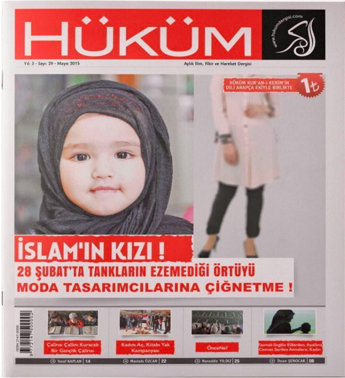
Görsel 4. “İslam’ ın Kızı” manşetli dergi kapağı (Hüküm Dergisi, 2015).

tanımlanmış Müslüman kadınların nasıl giyinmesi, nasıl yaşaması, nasıl görünmesi gerektiğine dair bir belirlenim ve toplumdaki yer ve rollerinin annelik odaklı olmasına dayalı bir tanım empoze etmişlerdir. Bu tanıma karşı çıkan diğer tüm İslami kadınları ise kendi din tahayyülleri ve dünya görüşlerine tehdit olarak görmüşlerdir.