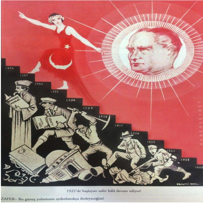
Görsel 3. Atatürk Etkisinde İlerleme Resmi, Ramiz Gökçe

koparak hayali bir ilerici” ulus ütopyasını gerçekleştirmenin siyasi sembolü olarak kullanılmıştır (Heng, 2004).