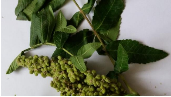
Şekil 1. Sumak (olgunlaşmamış meyve ve yapraklar)

kramplarında tercih edildiği belirtilmektedir (Güner, 2012; Tuzlacı, 2006; Tuzlacı 2011). Sumağın dizanteri, konjuktivit, karaciğer hastalıkları ve anoreksi yanında, saç tedavisinde, yanık ve dermatit gibi cilt hastalıklarında kullanıldığı açıklanmıştır (Ali-Shtayeh ve ark., 2013). Düzenli olarak tüketilen sumağın yağ oranı yüksek gıdaların sebep olduğu ateroskleroz, oksidatif stres ve karaciğer enzimleri üzerinde koruyucu etki yarattığı vurgulanmaktadır (Setorki ve ark., 2012). Azerbeycan’ da bu bitkinin meyvesi müshil etki gösterdiği için tercih edilmekte ve ayrıca hipertansiyon ve şeker hastalığında da kullanılmaktadır (Hasanova, 2000). İran’da diyarede sumak meyvelerinden yararlanılmaktadır (Zhalel, 2018). 1990-2010 yılları arasında sumak meyvesinden hazırlanan ekstrelerin bitkisel sepi maddesi olarak ihraç edilmesi, boyacılıkta, mürekkep yapımında veya veterinerlikte tercih edilmesi sumağın ekonomik önemini de ortaya koymaktadır (Kurt ve ark., 2014; Kızıl & Turk, 2010; Tiryaki 2010). Bu derlemede, bu kadar çok etnik kullanıma sahip bir baharat olan sumağın kimyasal bileşimi ve sumak üzerinde yapılan bazı önemli biyoaktivite çalışmaları hakkında bilgi verilmektedir.