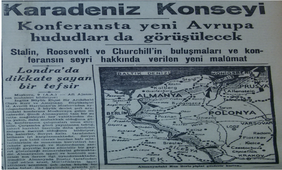
10 Şubat 1945 tarihli Tanin gazetesi