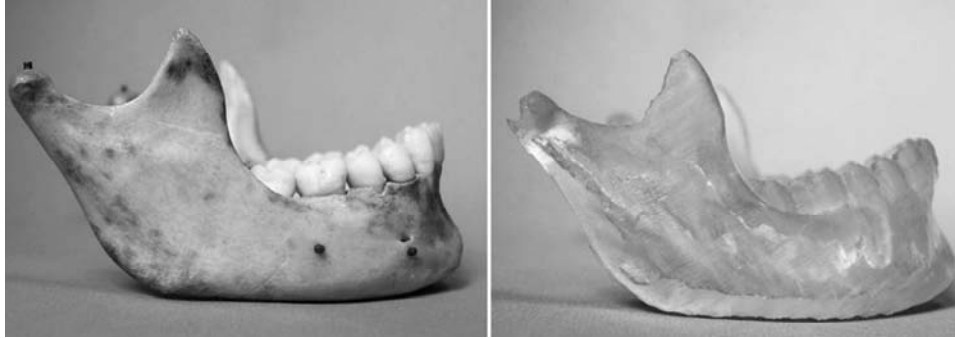
Figure 1: The mandible and the solid biomodel.

Resim 1: Kopyalanacak olan alt çene kemiği (solda) ve reçineden elde edilen kopya (Katı Biyomodel).