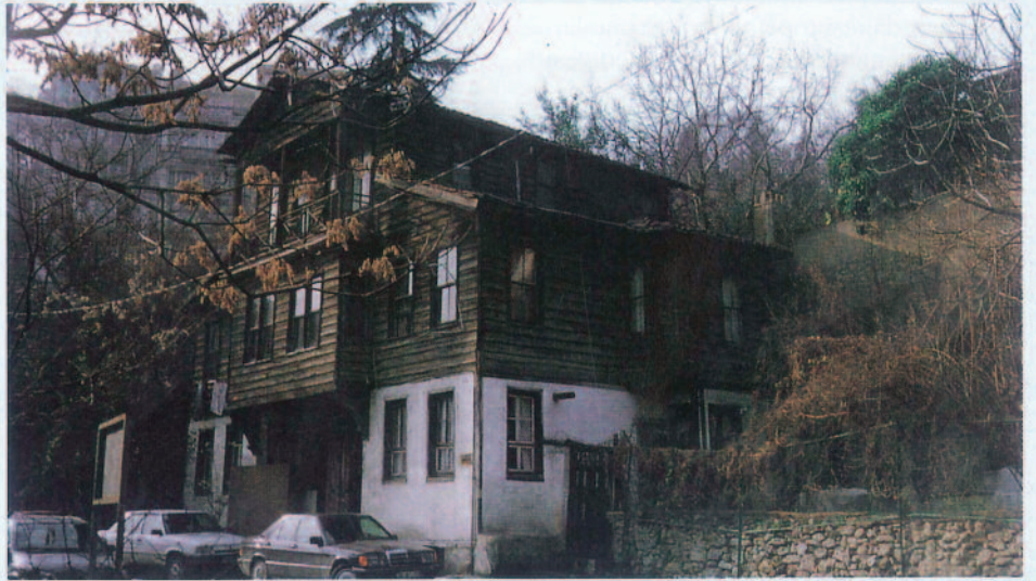
Sıracacı Sokağı'nda iki ailenin yaşadığı ikinci derece tarihi ev.

Geleneksel ailede izlenen ev-bahçe-mahalle bütünleşmesi, ortak bir mahremiyet anlayışı ve muhafazası, geniş aile yapısının aile bireylerinin sosyalleşmesinde getirdiği farklılıklar ve apartman hayatını kabullenememe nitelikleri ile bu konutların Osmanlı klasik dönemi konutlarının genel niteliklerini taşıdığı ve kültürel devamlılık içinde, onların bir uzantısı olduğu söylenebilir. Komşuluk ilişkilerinin yoğun yaşanması da, getirdiği toplumsal kontrol özelliği ve toplumsal baskı unsuru olmasıyla, geleneksel aile görüşünü güçlendirmektedir.