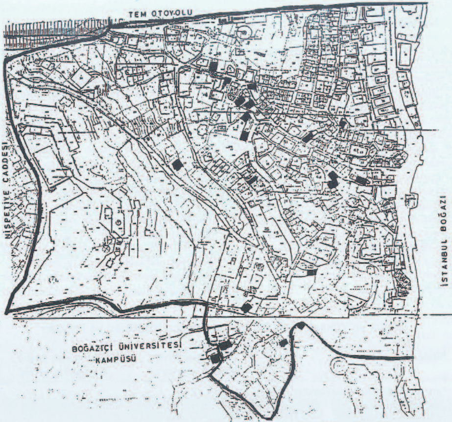
Görüşme yapılan evlerin haritadaki görünümü.

olduğunu yönünde yanıtlar vermişlerdir. Yüksek gelir grubu kaynak kişilerden 8'i, komşuluk ilişkileri olmadığını ve bunu çok önemsemediklerini, evlerinin onlara her şeyi ile yettiğini söylemişlerdir.