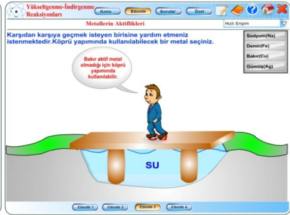
Şekil 4. Aktifliğin Uygulama Alanına Yönelik Olarak Kullanılan Bilgisayar Destekli Öğretim Materyali

Etkinlik-4: Aktifliğin uygulamasına ve sıralamasına başka bir örnek olarak etkinlik-4 hazırlanmıştır. Bu etkinlikte, Daniel Pili görselleştirilmiştir. Etkinliğin amacı bir pilde gerçekleşen olaylardan hareketle aktif metalin tespit edilebileceğini öğrencilere kavratmaktır. Hazırlanan Daniel Pilde, aktif olan Zn metalinin elektron verdiği, Cu^{2+} iyonunun da elektron aldığı görselleştirilmiştir.