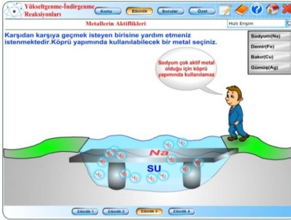
Şekil 3. Aktifliğin Uygulama Alanına Yönelik Olarak Kullanılan Bilgisayar Destekli Öğretim Materyali