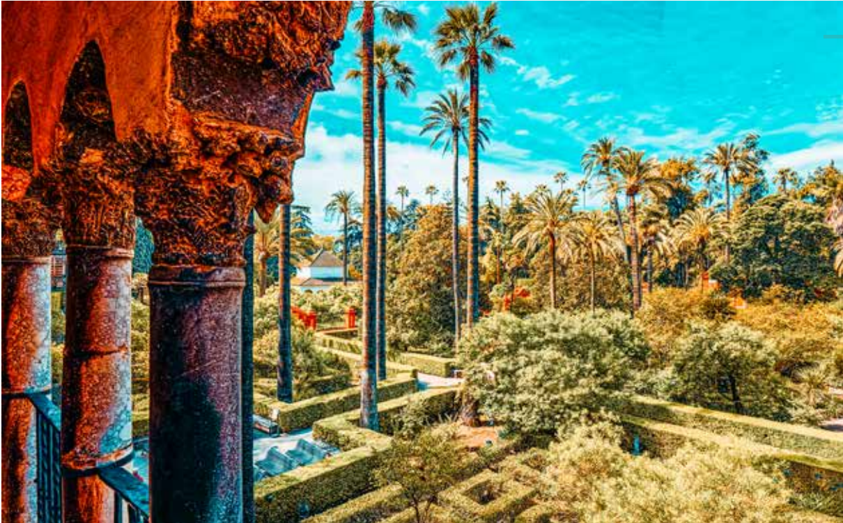
Alcazar, Sevilla, İspanya

“İslam için insan ne yeryüzüne düşen bir melek ne de utanç içinde dünyaya acı çekmeye gönderilen bir günahkardır. O, bir görev için gönderildi ve ilahi rehberliği kabul edip izlemek için sözleşme imzaladı. O, insanlara ve doğaya karşı görevlerinin bilincinde olan dindarlara sonsuz bahçenin söz verildiğine inanır. Hz. Peygamber dünyadaki varlıklara karşı tavırları ‘ölüm-den sonraki filizlere’ benzetmiştir. O