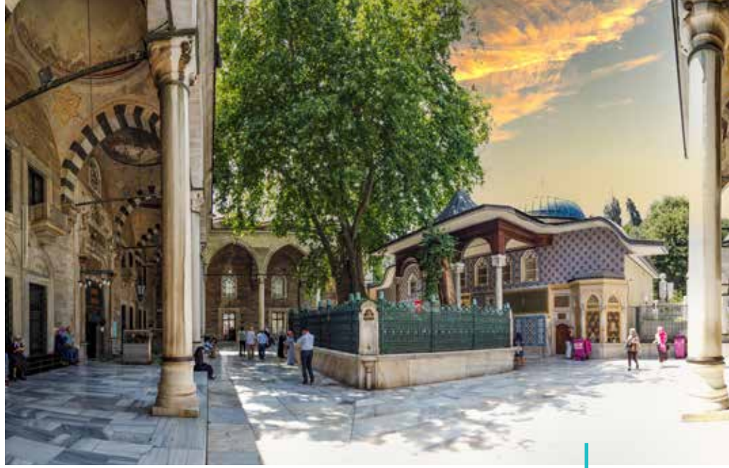
Eyüp Sultan Camii

Bahçeyi oluşturan tabiat unsurlarının belirginliği bu unsurları farklı ölçekte olsalar da, Süleymaniye avlusundaki ulu çınarlarda, mesire yerlerinin veya meydanların tek servi veya servi kümelerinde olduğu gibi büyük âbidevi varlıklar, tectonikler düzeyine ulaştırırken, çiçek tarhlarının içindeki çiçeklerin ve çiçek kümelerinin de tezyinî bir düzene ulaşarak transandantal bir çözümün objektif tezâhürü olacak