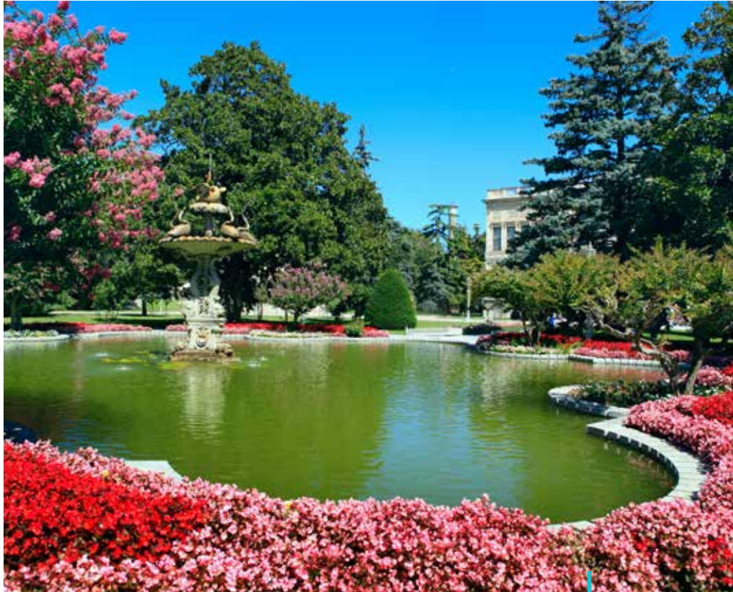
Dolmabahçe Sarayı, İstanbul

K ent estetiğinin bir parçası olarak bahçecilik ve çiçek yetiştiriciliği zanâatlar kadar sanatları içine alan böylece sanatkâr bir uğraşı olarak yorumlanabilecek bir alanı kapsar. Modern bilimlerin gelişmesi ile peyzaj mimarlığı içinde yerini bulan bu alanda tarım işçileri, bahçıvanlar, ev hanımları, çiçek severler emek verdikleri dokunuşları ve özenleriyle bir güzellik imgesi ve gerçekliği meydana getirirler. Bazen bir bahçeye hayat verilir bazen balkonda, terasta, saksıda ya da bir vazoda çiçeklerle şenlendirme ile taze bir anlam verilir hayata ve yeniden bir başka güzellik katılır. Doğal çevrenin düzenlenmesi ve biçimlendirilmesini içeren bu güzel görünüş, güzel koku ve âhengin eşsiz tasarımları kültürden kültüre değişiklik gösterir.