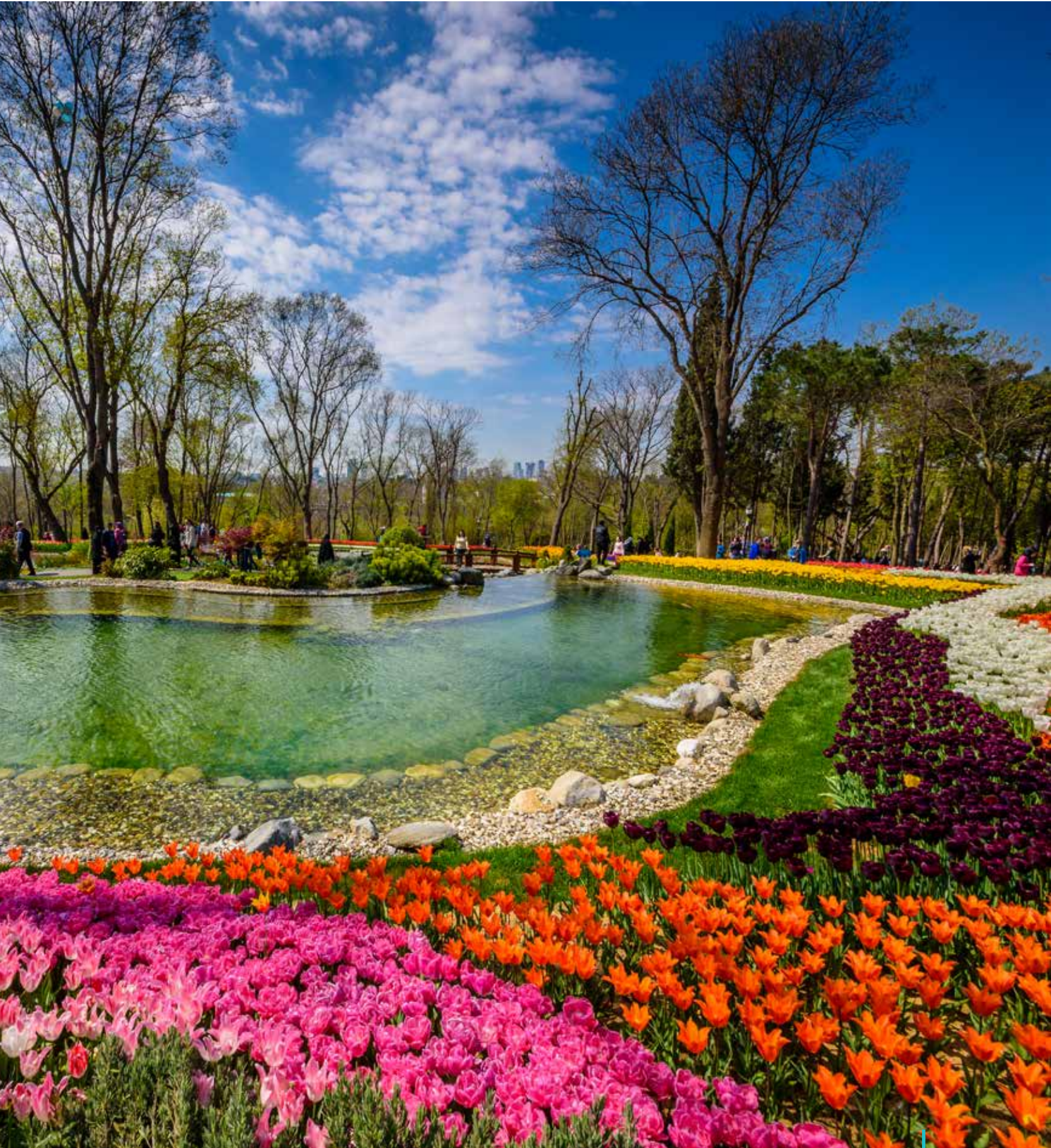
Emirgan Parkı, İstanbul