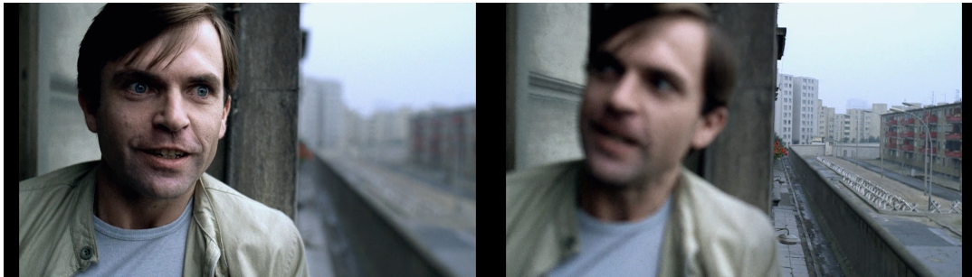
Görsel 4. Alan derinliği ile oluşturulan ilk odağın (Mark), ikinci odağa (Berlin Duvarı) kayması.

Possession 'da hem Mark ve Anna'nın evinin hem de canavarın olduğu eski bina Berlin Duvarı'nın karşısında konumlandırılır. Hikâyenin hem iç mekânlarda hem de dış mekânlarda, Berlin Duvarı'nın 22 etrafında gelişiyor olması Possession 'ün sınır-merkezli kurgusunu ve "yabancı" olmaya dair politik imalar barındıran yönünü güçlendirir. Duvar bu türden bir dışlama alanı yaratır. Berlin Duvarı, sosyo-mekânsal sınırların inşasıyla, belirsizlik ve süresizlikten oluşan bir dönemi temsil eder. Bu türden bir sınır, eşik bölgesinin her iki tarafı için de endişe kaynağı olmuştur.