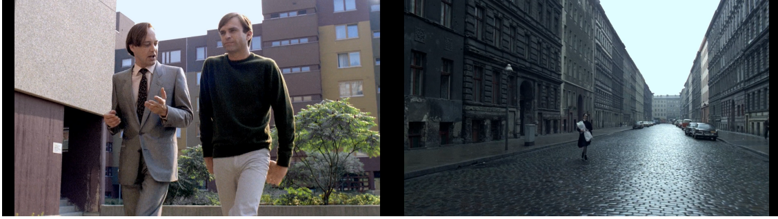
Görsel 6. Güneşli havanın, renkli, modern binaların olduğu bölge (sol) ve canavarın yaşadığı kapalı, kasvetli havanın ve eski binaların olduğu Kreuzberg bölgesi (sağ) arasında renk kullanımı farkı

Dedektiflik ofisi, okul ve Anna ve Mark'ın evinin bulunduğu bölgelerde (genellikle Vinetaplatz) hava güneşlidir. Dedektifle Mark'ın konuştuğu sahnede görüntüye güneş ışığı yansır, Berlin'in bu bölgesinde binalar modern mimariye sahiptir ve Kreuzberg bölgesine göre sıcak renklerle aktarılır. Buna karşın canavarın yaşadığı Kreuzberg semti Sebastian Caddesi'nde 23 binalar daha eski tarzda, koyu renklidir, hava kasvetli ve yağmurludur. Gri tonlarda ve ıssız olan bu bölge, kentsel çürüme hissiyatını da pekiştirir (The Other Side of the Wall, 2009). Kreuzberg sokakları kıvrımlı ve tekinsizdir. Kreuzberg sokaklarını istila ederek tekinsizleştiren, "abject" fantastik canavarın kendisidir. Bu anlamda filmdeki canavar olarak beliren ve yeni bir sınır aşımını zorunlu kılan varlık oluşturduğu tehdit ile önemli bir başka temsil odağı haline gelir. "Canavarsı-dişi" temsili olarak tehditkâr cinselliğiyle Anna ve Anna'nın bağlı olduğu canavar/yaratık varlıklarıyla ataerkil düzeni sembolik, sosyal ve fiziksel olarak tehdit etmektedir.