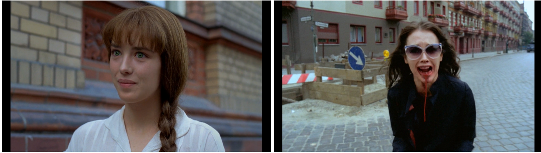
Görsel 12. “İdeal eş” temsili olarak Helen (sol), “canavarsı-dişi” temsili olarak Anna (sağ)

Anna'ya göre her insanın birden fazla yüze ihtiyacı vardır; ışığın her zaman gölgeye ihtiyacı vardır. Bu örneklerdeki gibi sözel olarak da desteklenen bu içsel parçalanma Anna/Helen ve Mark/Heinrich çatışmasıyla yansıtılır. Anna ve Mark, bu kişilik bölünmesinde eksiklikle kurgulanmıştır. Anna'nın Şans ve Kader söyleminde Helen, idealize edilmiş fedakâr kadınlık hallerini sergilemektedir. Anna ise tam tersine “dengesiz” eylemleri olduğu ve tehdit teşkil ettiği için “canavarsı-dişi” temsilidir. Anna'nın hem kurban hem de katil olması ile, Creed'in önerdiği abject, canavarsı annelik kodlarına uygun görünmektedir. Çocuğu koruma işi, Anna'nın görsel ikizi Helen'e bırakılır. Helen, Mark'ın dünyası için idealize edilmiş bir imaja sahiptir. Koyu lacivert tonları giyen Anna'nın tersine Helen, beyaz giyer ve Bob'a karşı anaç tavırlar sergiler.