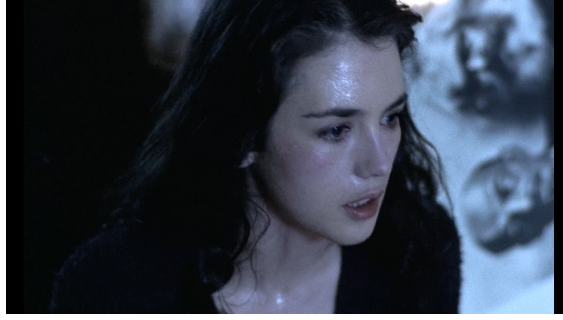
Görsel 11. Kamera kaydında Anna konuşurken arka planda bulunan, net olmayan Marx ve Lenin portresi

Anna'ya göre her insanın birden fazla yüze ihtiyacı vardır; ışığın her zaman gölgeye ihtiyacı vardır. Bu örneklerdeki gibi sözel olarak da desteklenen bu içsel parçalanma Anna/Helen ve Mark/Heinrich çatışmasıyla yansıtılır. Anna ve Mark, bu kişilik bölünmesinde eksiklikle kurgulanmıştır. Anna'nın Şans ve Kader söyleminde Helen, idealize edilmiş fedakâr kadınlık hallerini sergilemektedir. Anna ise tam tersine “dengesiz” eylemleri olduğu ve tehdit teşkil ettiği için “canavarsı-dişi” temsilidir. Anna'nın hem kurban hem de katil olması ile, Creed'in önerdiği abject, canavarsı annelik kodlarına uygun görünmektedir. Çocuğu koruma işi, Anna'nın görsel ikizi Helen'e bırakılır. Helen, Mark'ın dünyası için idealize edilmiş bir imaja sahiptir. Koyu lacivert tonları giyen Anna'nın tersine Helen, beyaz giyer ve Bob'a karşı anaç tavırlar sergiler.