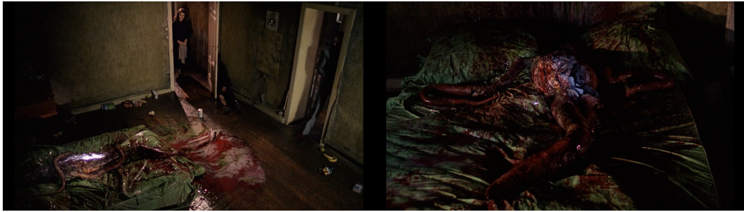
Görsel 7. Yatakta konumlanan canavardan akan kan ve irin benzeri sıvı

Sınırlar, yalnızca ulusal kimlik için değil, aynı zamanda ve özellikle bireysel beceri ve erkeklik gösterileri için de önemlidir. Bu anlamda abject mekânlar, sosyal ve kültürel olarak sınırların hakimiyetini kaybettiği alanlar olarak temsil edilebilir (Kelly, 2013, s. 57). Canavarın yaşadığı daire yüksek tavanlı ve eski, yıkılmaya yüz tutmuş, karanlık ve ürkütücüdür. Bu eski, az eşyalı ve kirli dairenin gizli iç mekânları vardır. İç odaların fazlalığı, karanlık ve nemli yapısı nedeniyle canavarın yaşadığı daire anne bedeniyle ilişkilendirilebilir. Çevresindeki erkeklerde kastrasyon korkusu uyandıran “tehlikeli” anne figürü Anna, eril mağduriyetin asıl kaynağı olacak olan güce (iktidara) yaklaşarak bu ilişkiyle geleneksel rollerinden/sınırlarından ayrılmaktadır.