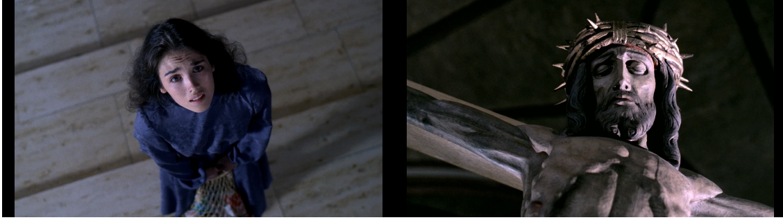
Görsel 8. Anna kilisede İsa heykeline bakarak anlaşılmas sesler çıkarır