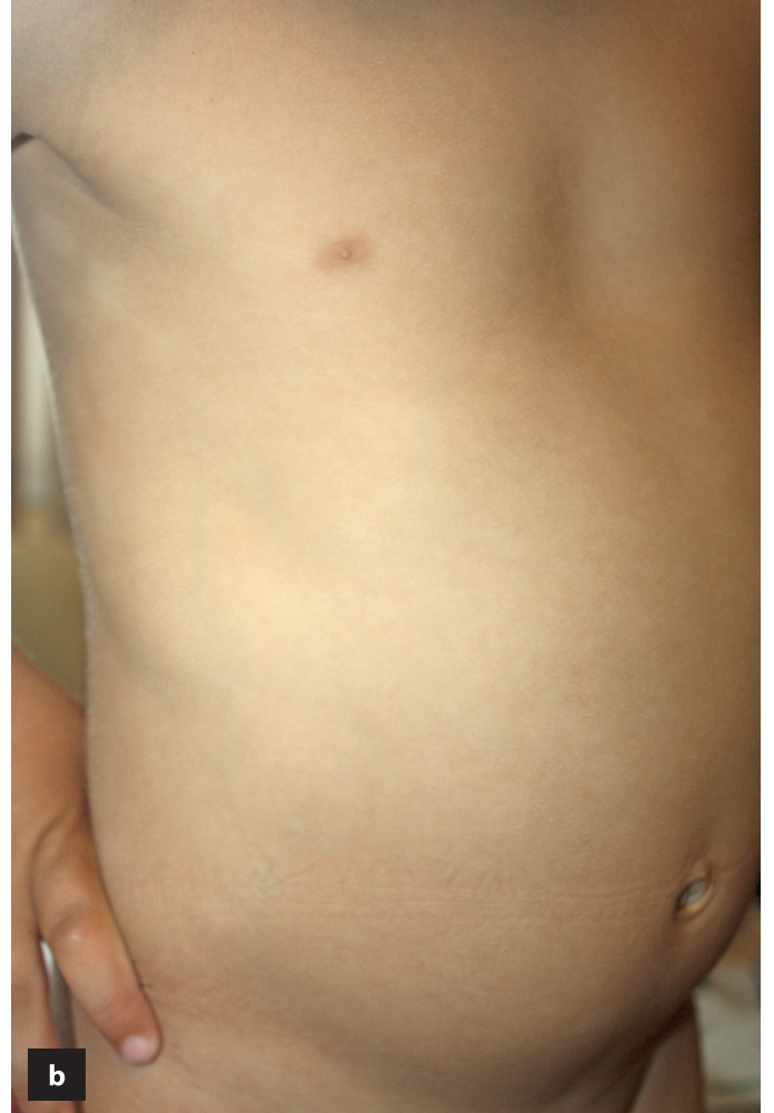
Resim 2. a) Mikozis fungoides tanısı olan iki yaşında çocuk hastanın tedavi öncesi hipopigmente yamaları, b) dar bant ultraviyole B sonrası klinik düzelme