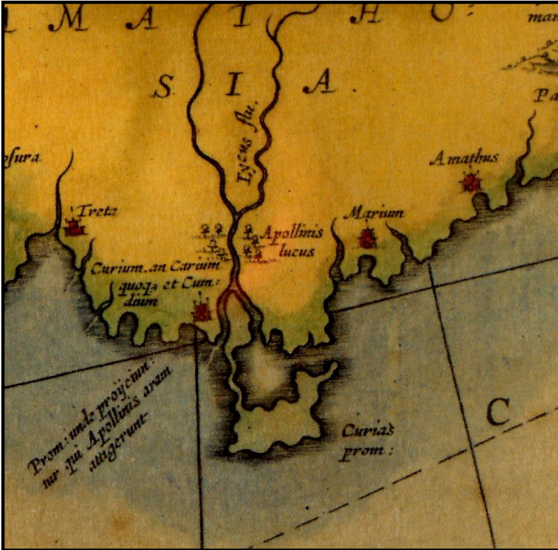
Harita 2: Akrotiri Yarımadası ve Akrotiri Tuz Gölü’nü Deniz ile Bağlantılı Gösteren Tarihi Bir Harita (West, 2007).

Bugün için Akrotiri tuz gölünden tuz elde etmede istifade edilmemekte olup, doğal özellikleriyle adından söz ettirmektedir. Göl ve yakın çevresi özellikle kış döneminde kuşların göç yolu üzerindeki önemli dinlenme alanlarından birisi olup her yıl sayıları 2.000 ila 20.000 arasında değişen flamingoya barınak vazifesi görmektedir.