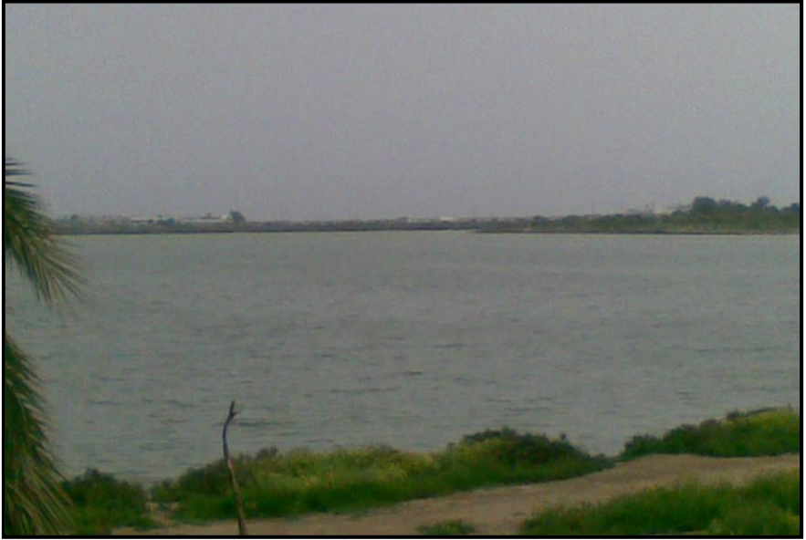
Fotoğraf 2: Larnaka Tuz Gölü'nün Güneybatı Kesiminden Bir Görünüm