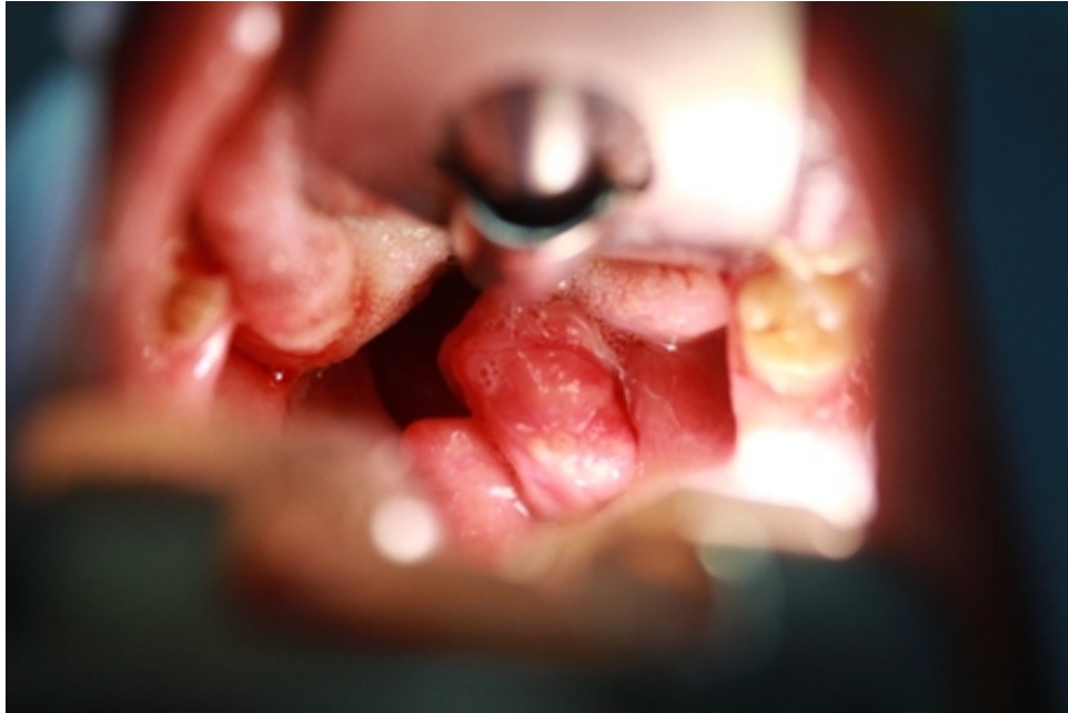
Şekil 1 : Davis-Boyle ağız açacağı ile sağ palatine tonsile yapışık düzgün sınırlı kitle

Otuzbir yaşında kadın hasta yutma güçlüğü sebebiyle kliniğimize başvurdu. 1 ay önce geçirmiş olduğu üst solunum yolu enfeksiyonu sonrasında şikayetinin başladığını belirten hastanın muayenesinde sağ palatin tonsil asimetrik hipertrofik görüldü. Hastanın yakın zamanda kilo kaybı, nefes darlığı şikayeti ve kronik hastalık öyküsü yoktu. Endoskopik muayene de nazal kavite, nasofarenks, hipofarenks ve larenks muayenesinde ek patoloji gözlenmedi. Yapılan boyun muayenesinde lenfadenopati palpe edilmedi. Kitle; tonsil dışında komşu yapılara invaze olmayıp tonsil loju ile sınırlı olduğu için ek radyolojik tetkik istenmedi. Takibinde hastaya tanı ve tedavi amacıyla sağ tonsillektomi planlandı. Genel anestezi altında trans-oral yolla sağ tonsilde asimetrik düzgün plan veren kitle sağ tonsil dokusuyla birlikte eksize edilerek patoloji bölümüne gönderildi (Şekil 1).