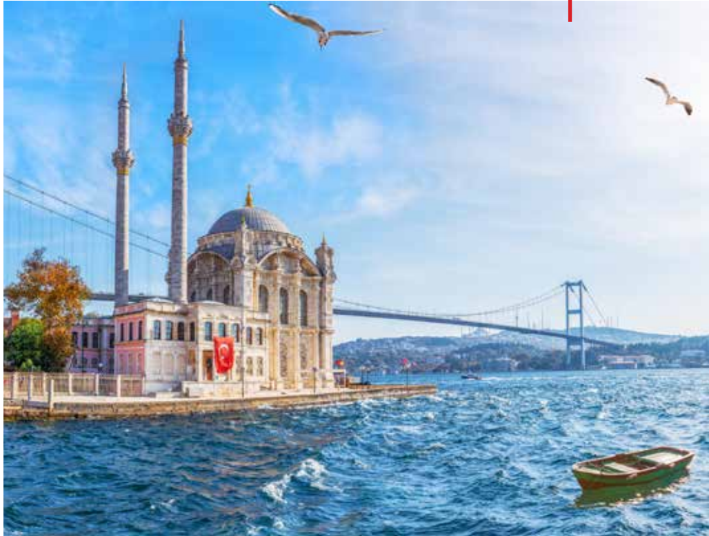
Ortaköy Camii, İstanbul

Turgut Cansever yazını, şehir konusundaki sorunu teşhis etme, çözümleme sonrası bizi çözüm yollarını araştırmaya yönlendirmektedir. Bu mesele hakkında bilgi sahibi olan salâhiyetli bir şahsiyet olarak bizi murakabeye davet etmektedir. 📖