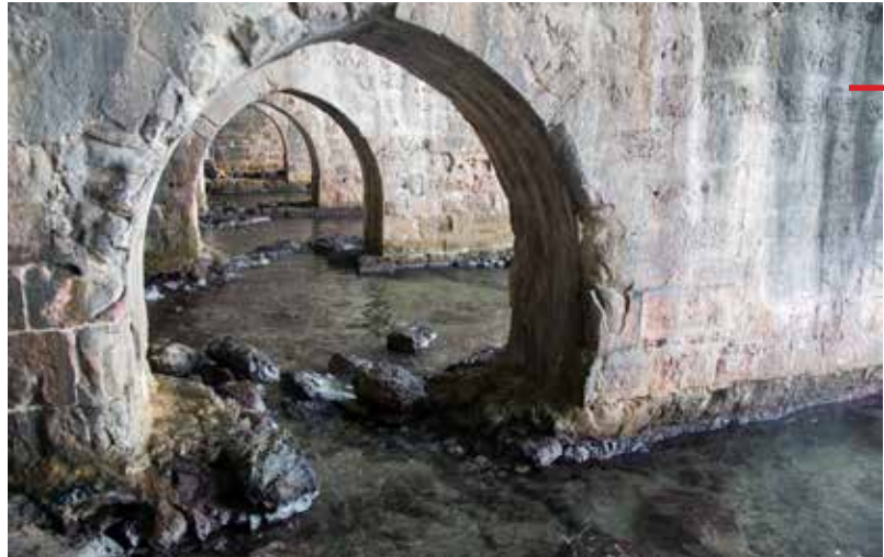
Alanya Kalesi'nin tersanesi içindeki kemerler

ne Arap, ne Ermeni, ne Bizans'tır. İlk eserlerde, başlangıçta eklektik unsurlar var, seçmece hepsinden alınıyor, sonra bir kompozisyona erişiliyor. Onlar Selçuklu üslûbundan biraz farklı. Böylece hem şehir kurarken hem âbide yaparken hem de büyük şehirlerde ev inşâ ederken farklı resimler çıkıyor ortaya. Turgut Cansever bunları gördü, inceledi. Doğal olarak sanat tarihi doktorası yapmış gözlerin ve zihnin esere bakması başka bir görüş sunmaktadır. Sonra Osmanlı geliyor, erken Osmanlı, olgun Osmanlı ve sonra bozulmuş Osmanlı.